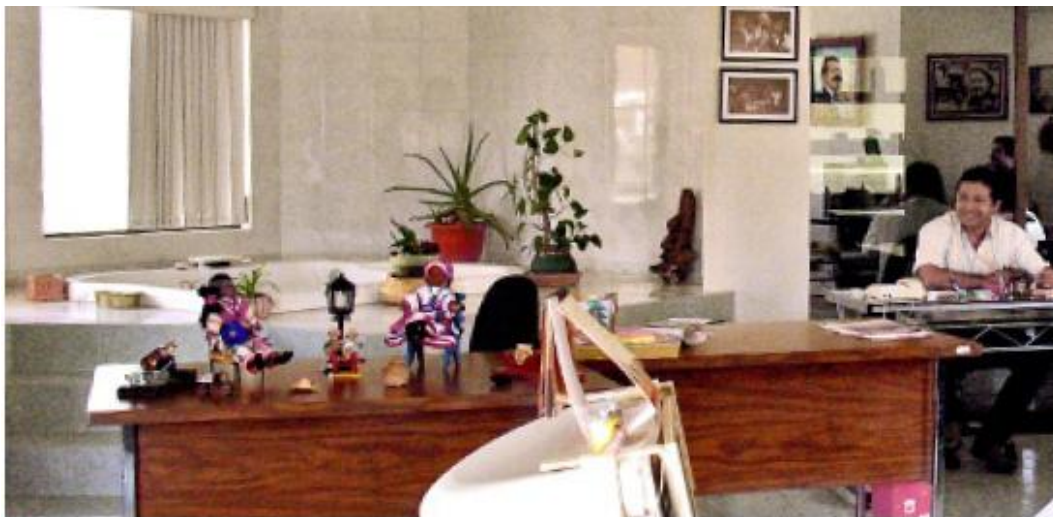
> Algunos empleados del Instituto de Cultura de Durango despachan en una de las habitaciones con jacuzzi.