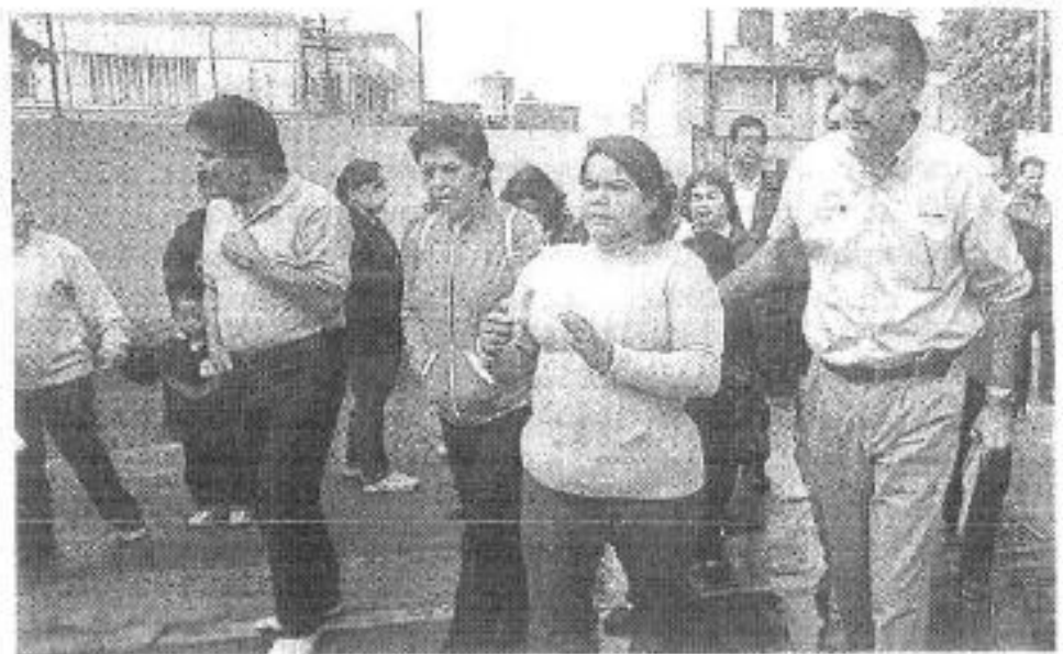
El funcionario federal revisó los centros escolares

El regreso a clase de más de 4 mil 700 alumnos el próximo 17 de agosto dependerá de cada uno de los casos y en el avance de los trabajos de mantenimientos de los plateles y la reposición de herramientas de trabajo como inmobiliario y computadoras, entre otros enseres necesarios para la instrucción de los diferentes ni-