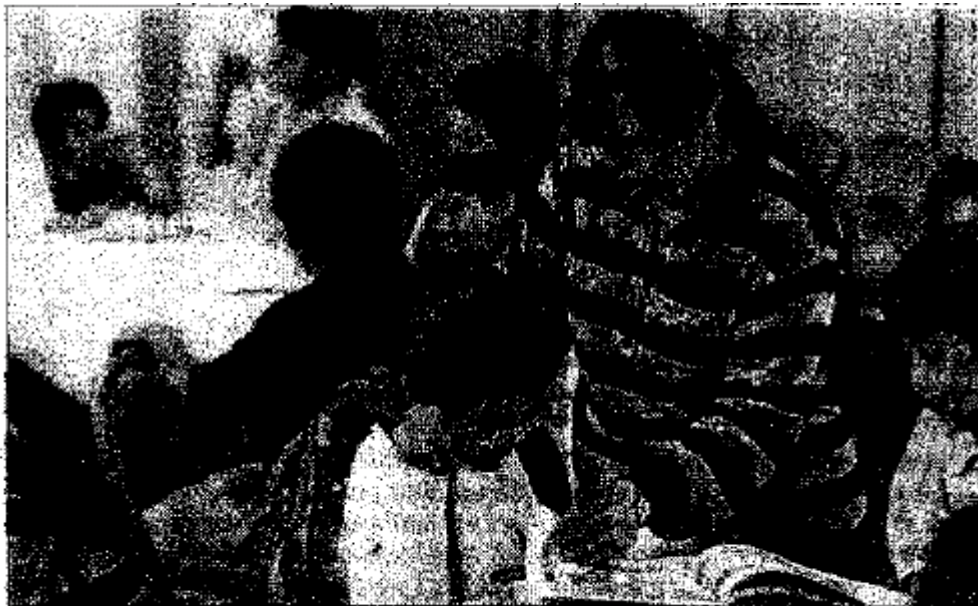
» LA REFORMA Integral de la Educación Básica (RIEB) afecta a unos 26 millones de niños y niñas de entre tres y 15 años.

Frente a algunas voces que aseguran que esta reforma educativa "cercena" parte de la historia mexicana como la Conquista, la Colonia y el Movimiento de Independencia, González aseguró que estas críticas "no están sustentadas".