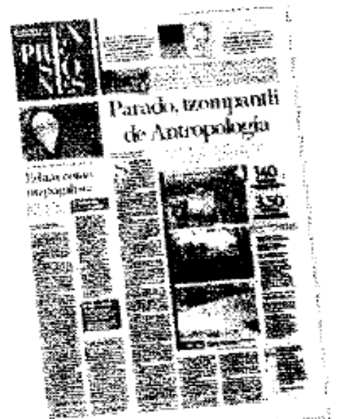
Excelsior dio a conocer que el INAH proyecta un muro.

De acuerdo con el abogado, el próximo 25 de septiembre el INAH dará a conocer los detalles de la obra al Consejo Rector.