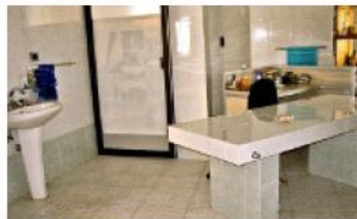
> La sala de masaje es otro de los atractivos de la casa.