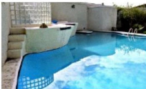
> La residencia que ocupa el instituto cuenta con una alberca.