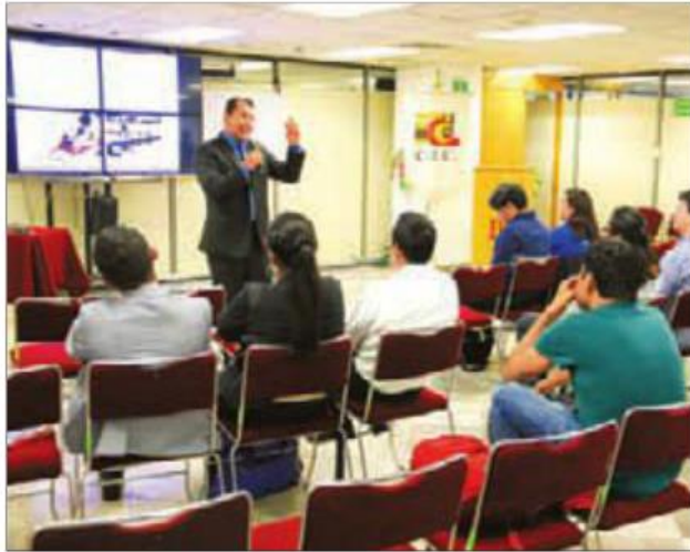
Una de las conferencias del simposio.