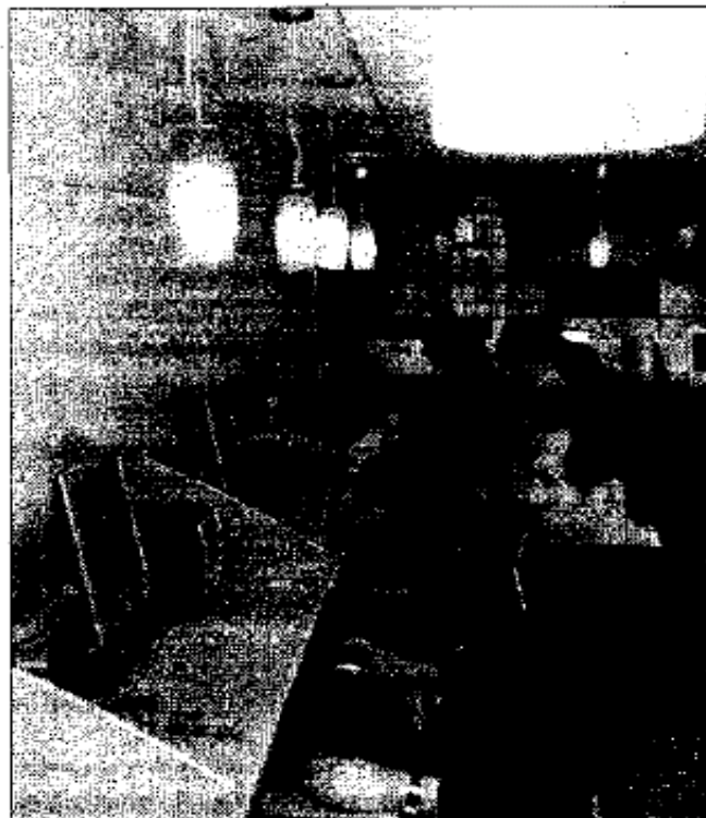
Conectados. Habrá 20 cibercentros en las estaciones.