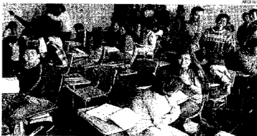
Se amplió la oferta educativa para los jóvenes mexiquenses