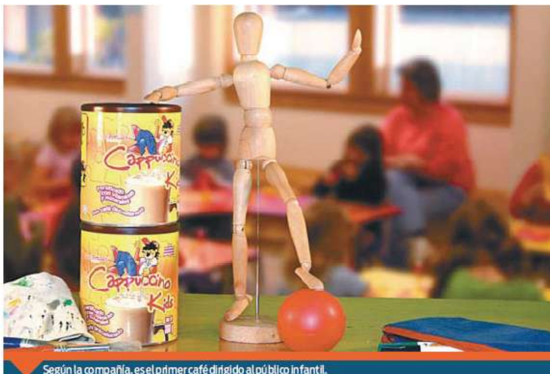
Según la compañía, es el primer café dirigido al público infantil.

De entre quienes consumen café listo para beber, 29 por ciento prefiere el americano, seguido del capuchino y el expreso. De estos consumidores, 35 por ciento lo adquiere en cadenas especializadas, 28 por ciento en tiendas de conveniencia, 24 por ciento en cafeterías independientes, seis por ciento en máquinas de monedas y el resto en restaurantes o loncherías.