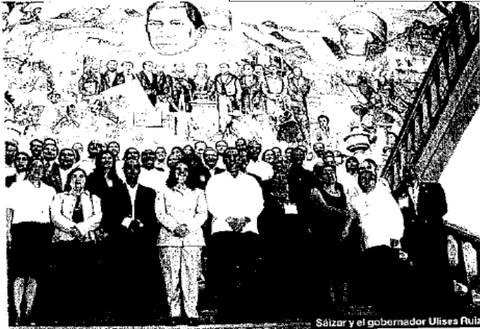
Secretaría de Cultura del Gobierno del estado de Oaxaca