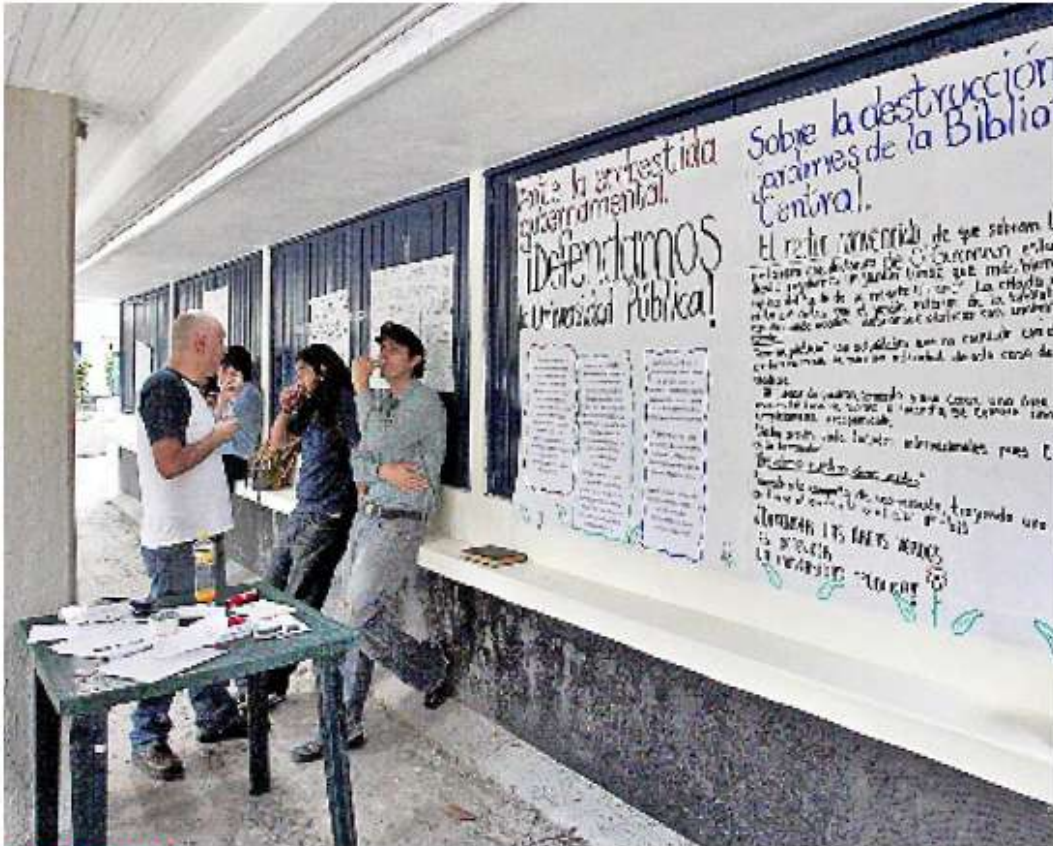
ACTIVISMO. En el primer día de clases del semestre estudiantes de Filosofía comenzaron un movimiento en contra de modificaciones en la zona del jardín de la Biblioteca Central de Ciudad Universitaria.