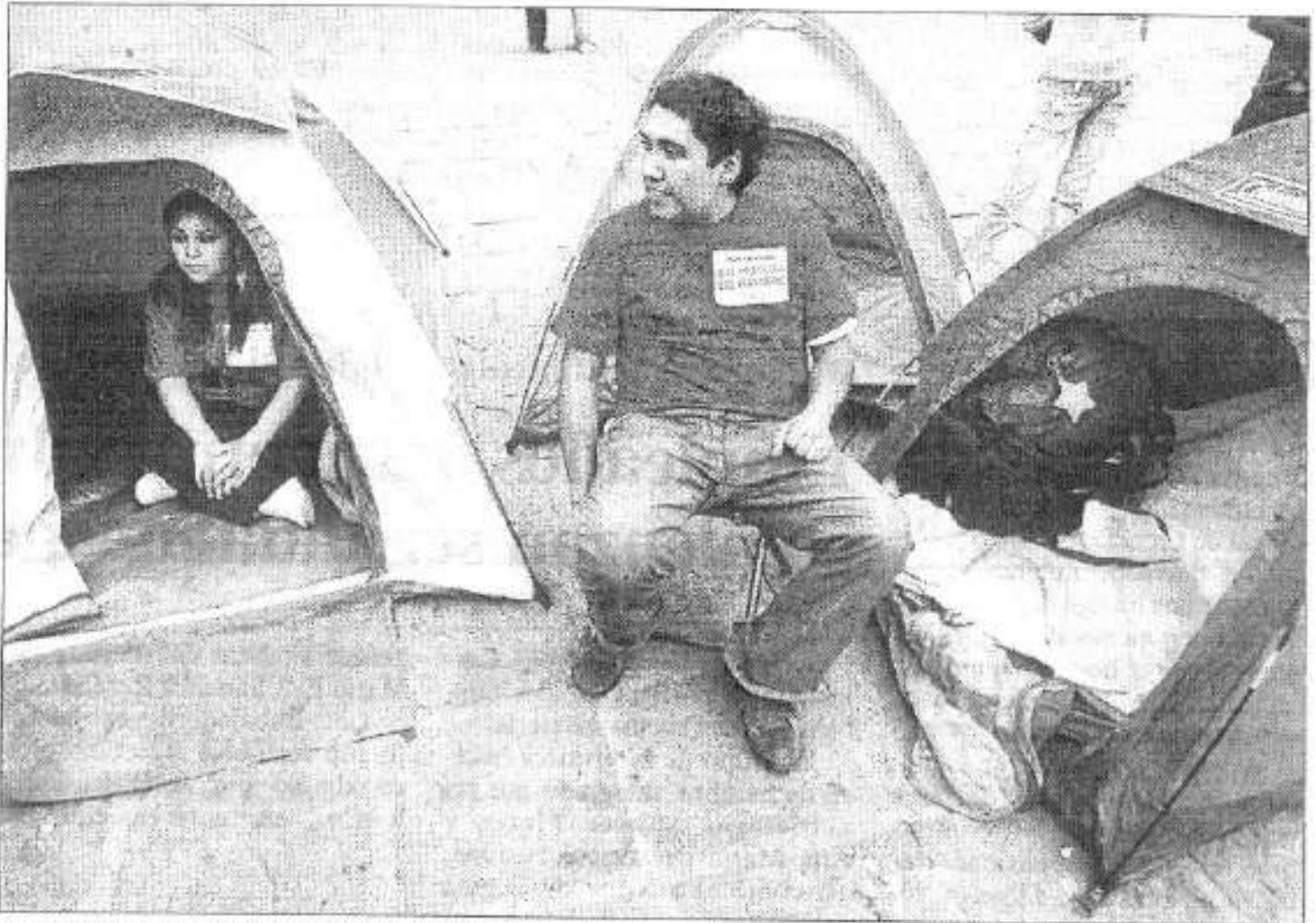
Los rechazados advirtieron ayer que no dejarán de movilizarse hasta que la Secretaría de Educación Pública atienda su exigencia