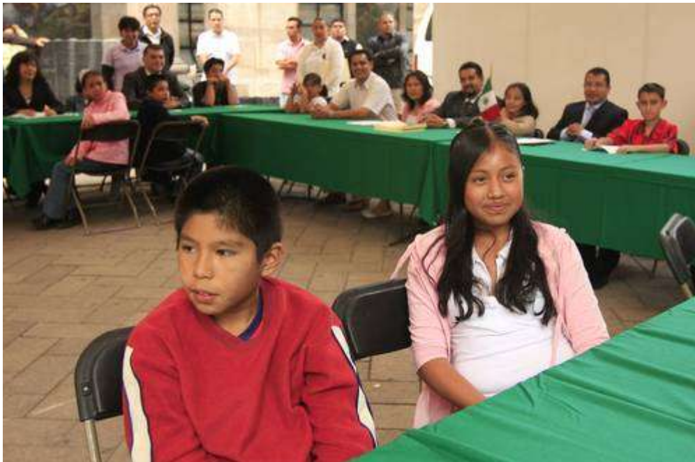
PARTE DEL GABINETE INFANTIL QUE LABORÓ AYER EN LA DELEGACIÓN TLALPAN