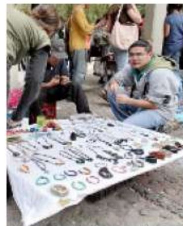
► Algunos ambulantes volvieron en el primer día de clases en la Facultad de Filosofía de CU.