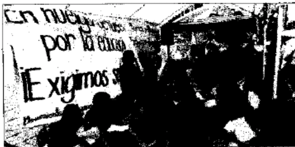
» RECHAZADOS EN la Plaza de Santo Domingo.