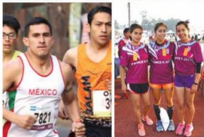
Los politécnicos demostraron su capacidad en la carrera de 21 kilómetros.