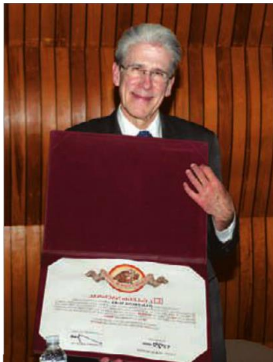
Julio Frenk ingresó a El Colegio Nacional en una ceremonia encabezada por Enrique Krauze y Guillermo Soberón.

Añadió que también debe ser integral y ofrecer a los pacientes una cobertura en todo el ciclo del proceso salud-enfermedad; continuo; que exija la cobertura en todo el ciclo de vida de las personas, con énfasis en el manejo de la cronicidad, predominante en el panorama epidemiológico. "Debe ser diversificado, lo que propone novedosos espacios para la atención hospitalaria, ambulatoria y domiciliaria, para responder a las