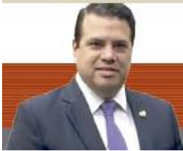
Por Gerardo Flores Ramírez *