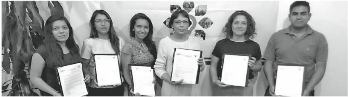
LOS ESTUDIANTES beneficiados cursan la carrera de Ingeniería Aeronáutica de la Universidad Politécnica Metropolitana de Hidalgo

PACHUCA, Hgo. (OEM-Informex).- Con la finalidad de impulsar el desarrollo entre la juventud de nuestro estado, la Secretaría de Educación Pública de Hidalgo (SEPH), a través del Instituto Hidalguense de Financiamiento a la Educación Superior (IHFES) brinda apoyo con financiamientos educativos para que estudiantes de la carrera de Ingeniería Aeronáutica de la Universidad Politécnica Metropolitana de Hidalgo (UPMH) asistan al programa anual que se celebra entre la institución educativa antes mencionada y la Univer-