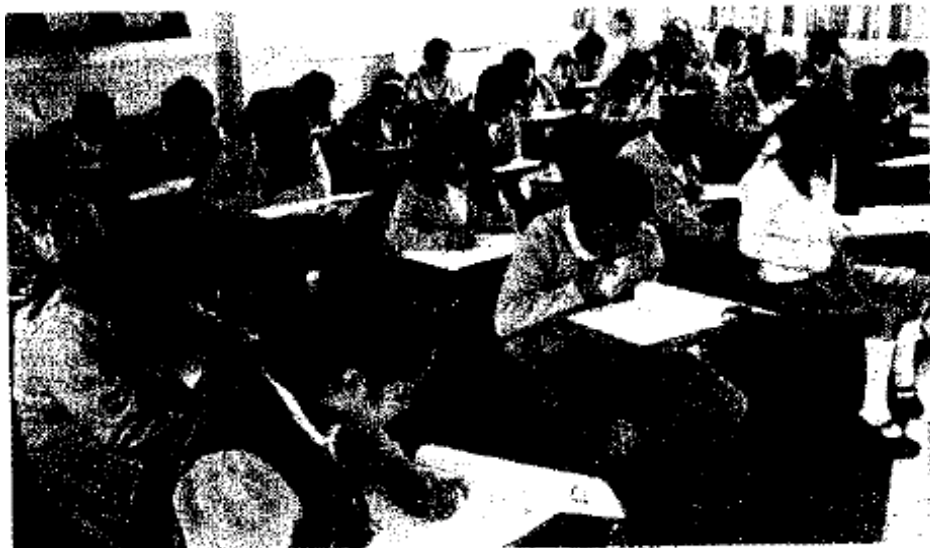
> Alumnos de sexto de la primaria Primero de Mayo, en Tlalnepantla, hicieron la prueba ayer.