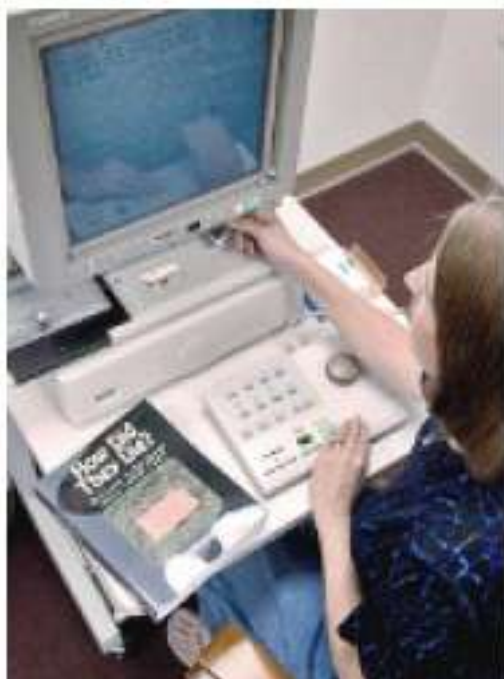
> Editoriales de EU ven con agrado que Google venda libros electrónicos.