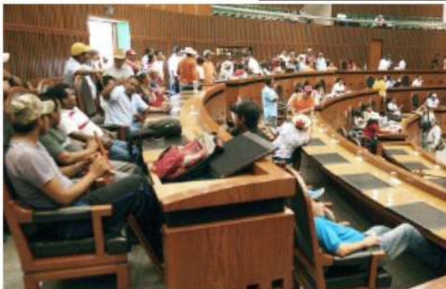
> Una vez adentro tomaron las curules en espera de respuesta a sus demandas.