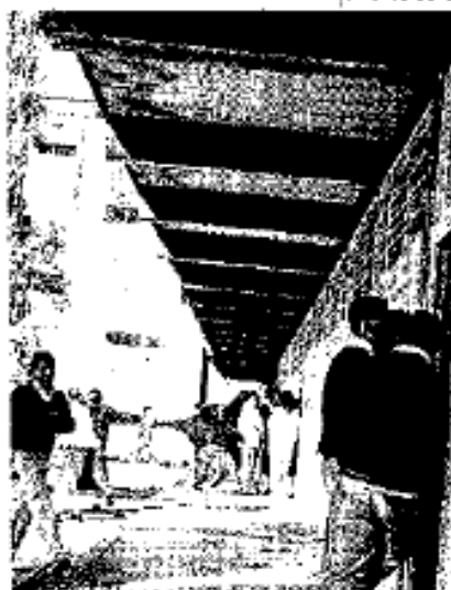
Una opción más para estudiantes

3 mil 150 espacios para alumnos de nuevo ingreso, por lo convocamos a los estudiantes de tercero de secundaria y egresados de ese nivel educativo, a continuar su bachillerato en nuestra institución".