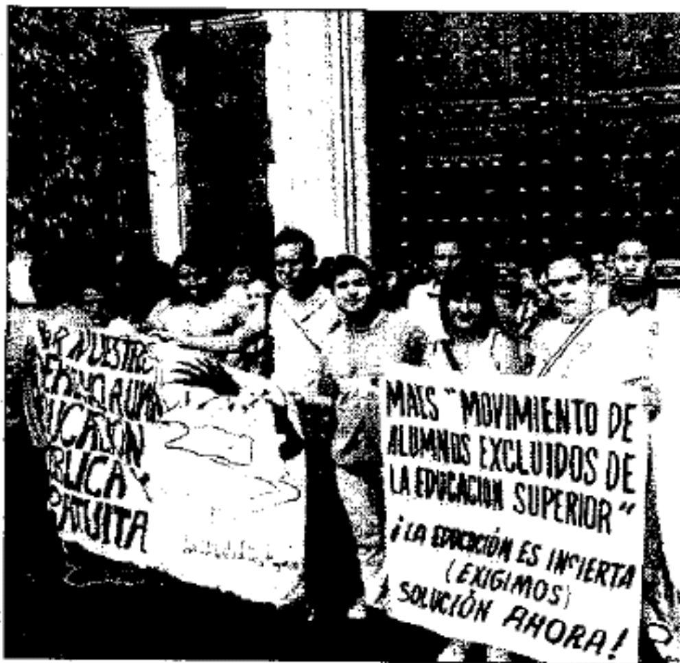
Estudiantes rechazados por la UNAM exigieron frente a la SEP un espacio en la educación superior