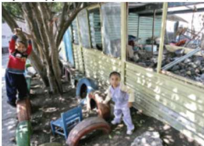
> Al kínder Jetzemani, en Iztapalapa, acuden 12 niños. Este centro carece de recursos para mejorar sus aulas, como lo pide la SEP.

El kínder “Los pequeños de Villalpando”, ubicado en la Colonia Mesa Los Hornos, en Tlalpan y que atiende a 170 niños, uno de los cen-