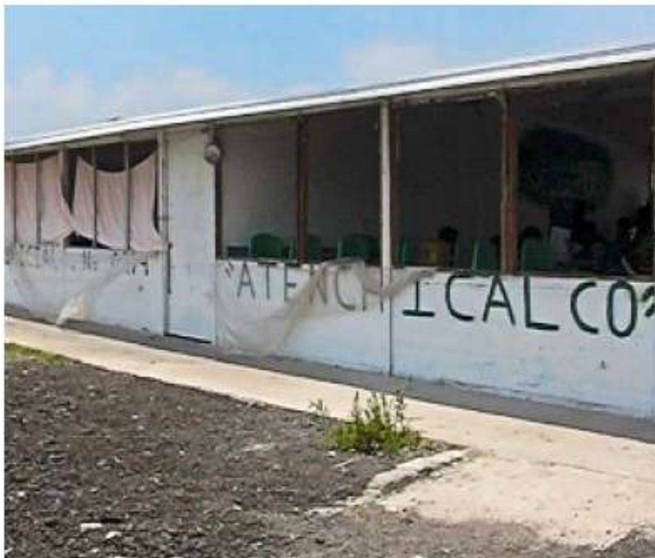
> La secundaria Atenchicalco, de Valle de Chalco, espera ser rehabilitada. Los padres de familia la construyeron con más ganas que presupuesto.

Un reporte oficial del Sistema de Infraestructura Educativa señala que, al 15 de mayo, no se habían ejercido los recursos del presupuesto 2009 del Instituto Nacional para la Infraestructura Física Educativa (Inifed).