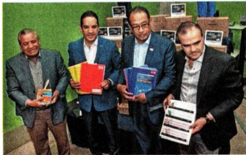
El gobernador de Querétaro, Francisco Domínguez Servián (segundo de izq. a der.) destacó que el gobierno busca apoyar a los padres de familia.

Autoridades explicaron que para el nuevo ciclo se analizó el mecanismo usado el año anterior y se logró la mejora del mismo: se elevó la calidad de los materiales, se entregarán más he-