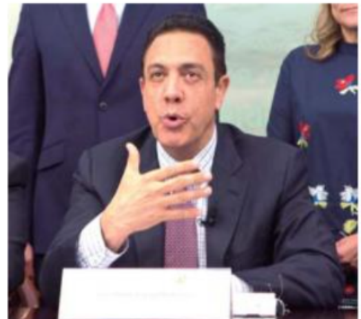
Omar Fayad, gobernador de Hidalgo.

forma los paquetes de útiles escolares que, señaló, "mamá y papás saben que los recibirán porque se trata de una acción institucional ya consolidada que va más allá de administraciones públicas, estrategias y programas temporales".