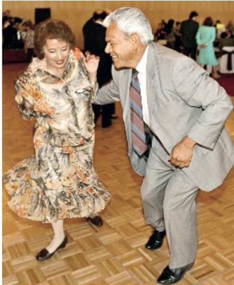
FESTEJO. Los homenajeados disfrutaron el día del maestro bailando rock, cumbia y cha-cha-chá en el salón Los Candiles, en Polanco.