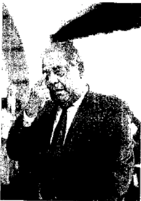
Carlos Jonguitud Barrios, secretario general del SNTE (1973-1975).

Desde esa humilde posición arrancó el niño Carlos su carrera a las más altas esferas del poder para lo cual, nada gley, se afilió al PRI en 1942 y luego se tituló como profesor. En el pándote, un trienio fue gato de Manuel Sánchez Vite (a quien destronaría del SNTE décadas