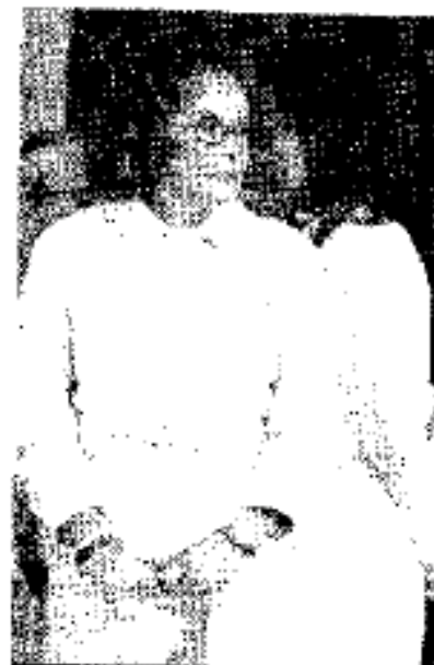
DIVORCIO. La Comisión Rectora suspende actividades y las protagonistas se distancian.