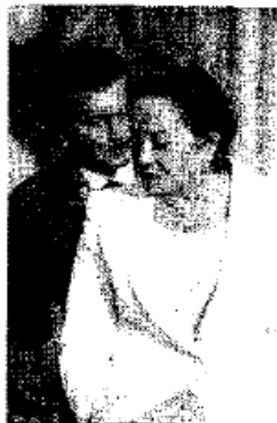
LA RECONQUISTA. Gordillo llamó "amigo" al titular de la SEP. Inicia el matrimonio.