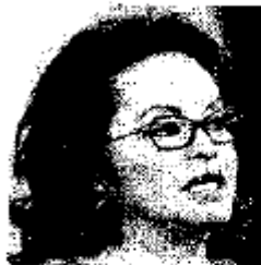
ELBA ESTHER GORDILLO, líder del SNTE.

El error estratégico del Mandatario fue apostar a que el Sindicato Nacional de Trabajadores de la Educación liderara el pacto educativo. Calderón no sólo perdió en tiempo, sino también en la salida de quien fungiera como Secretaría de Educación y que se fue con las manos vacías, en busca de una curul.