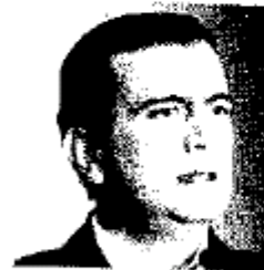
ALONSO LUJAMBIO, titular de la SEP.

Ahora aspirante a una curul, Vázquez Mota se vio debilitada públicamente al aparecer como la sombra de Elba Esther cuando se abordaba el tema de la Alianza. Había la percepción de que el presidente Calderón le restringía el apoyo.