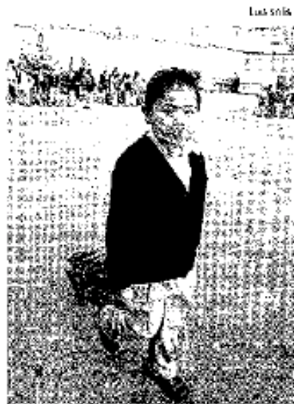
Luego de la contingencia a clases

En la primaria anexa a La Normal de Ecatepec ubicada en la avenida de Los Maestros, esquina Independencia en la colonia Santa Agueda, hay incertidumbre entre los mentores de la zona, ya que en una manzana se encuentra la Normal, oficinas administrativas del Sistema de Educación del Estado de México, además de la primaria, que cuenta con mil 700 alumnos en sus dos turnos.