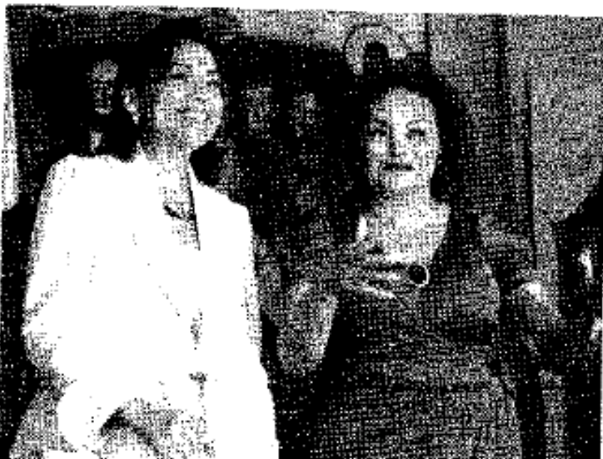
LA INFIDELIDAD. Elba Esther le da la espalda a los maestros y apoya la convocatoria al primer examen de oposición.