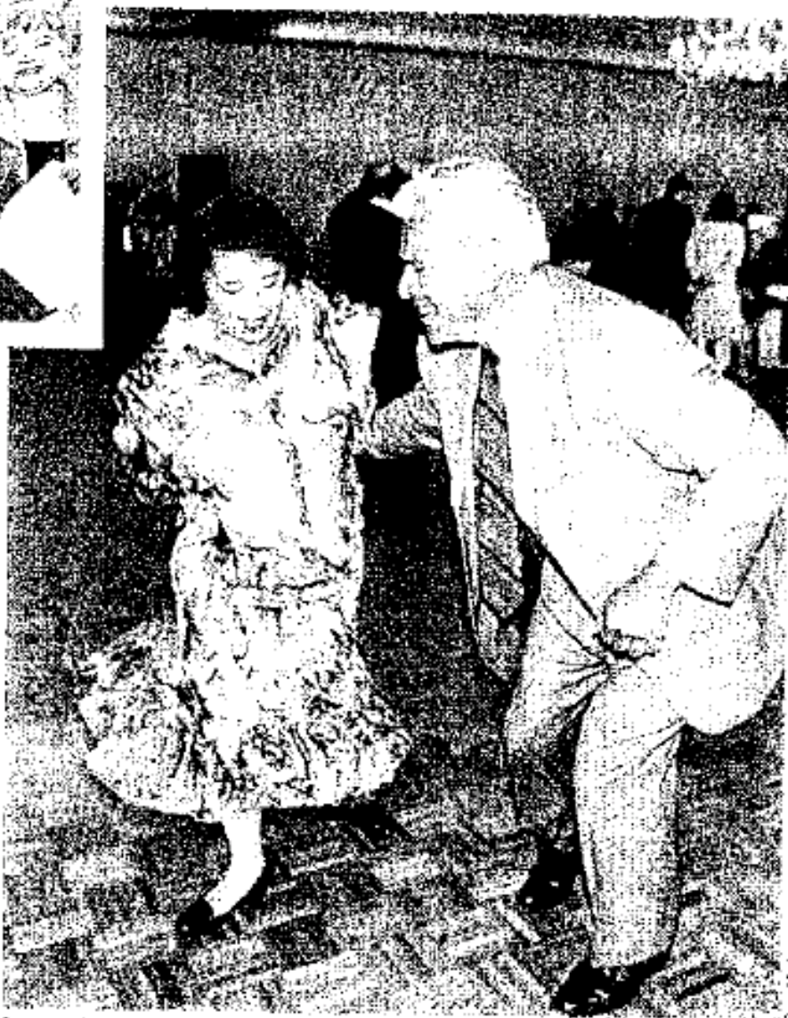
Los profes bailaron para festejar su día, durante un desayuno que les ofreció la SEP, donde abuchearon a Elba Esther Gordillo, líder del SNTE.