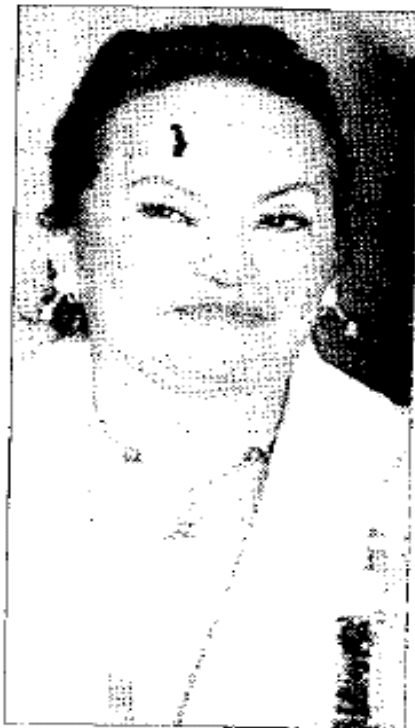
Elba Esther Gordillo en imagen de archivo

La SFP recibió la denuncia del comisionado del IFAI, Juan Pablo Guerrero, en octubre de 2008, por incumplimiento de la resolución de ese instituto, conlleva aquella entidad en su oficio DGI/DGAV/311/232/2009, así como la queja de Estrada, interpuesta en el órgano interno de control dependiente de la PGR.