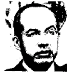
FELIPE CALDERÓN, presidente de México.

Los protagonistas de la Alianza por la Calidad de la Educación han sido testigos del fracaso en las metas de los ejes planteados el 15 de mayo del 2008. Tras un fuerte impulso del pacto educativo, éste no ha logrado arribar a buen puerto.