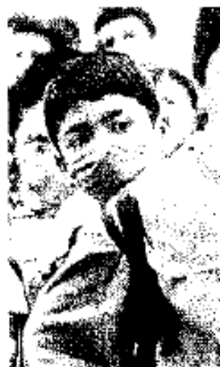
El cierre de calificaciones finales no se cambió, dice