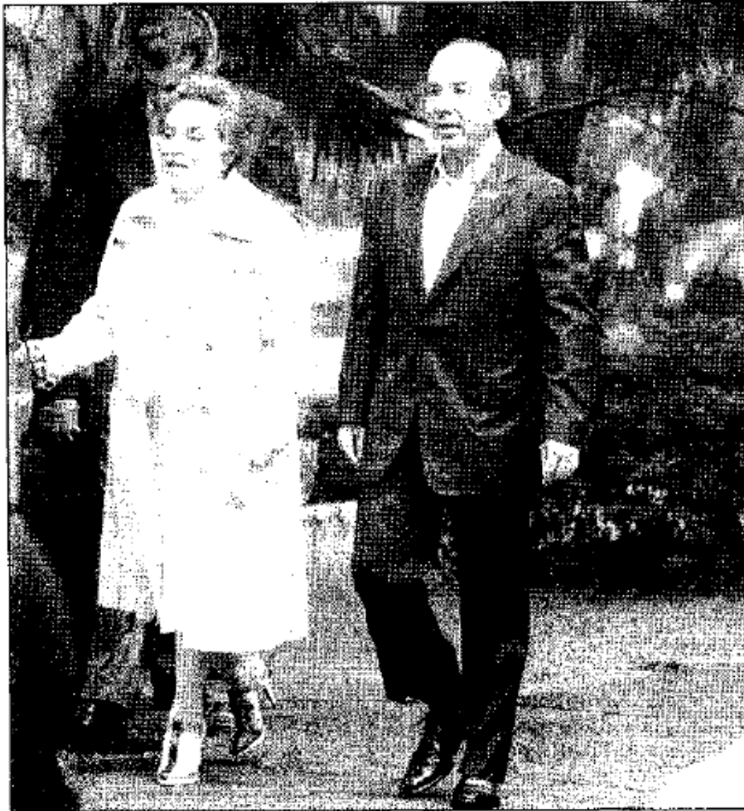
El Presidente junto a la líder del SNTE; atrás, el titular de la SEP. (David Rojas)