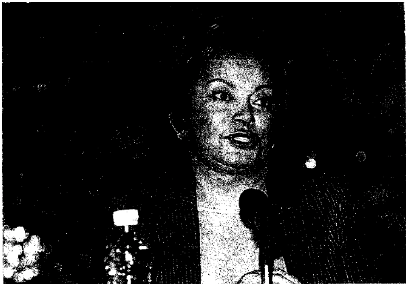
La maestra Elba Esther Gordillo, dirigente nacional del SNTE, enfrentará una fuerte campaña entre sus agremiados bajo el lema "si pierde el Panal, la Perpetua caerá".