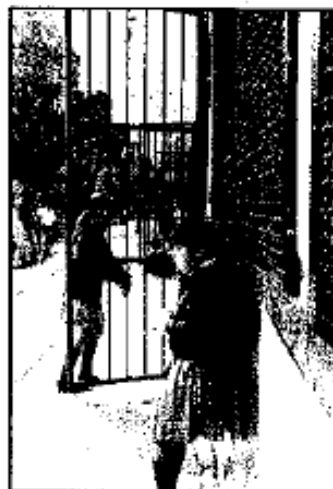
Afectan la escuela Graciano Sánchez

La SEP registra 2 mil 600 denuncias de robo entre 2006 y 2008 de las computadoras, de las aulas de medios; así como de televisiones, pizarrones, micrófonos, bocinas, impresoras, teléfonos, cables y plumillas del programa Enciclomedia.