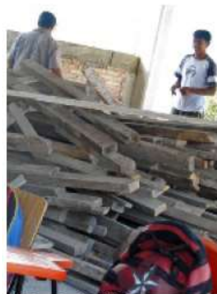
> Padres de familia fueron contratados para hacer las obras.

El director de este plantel, mencionó van a esperar que la Secretaría de Educación en Guerrero les otorgue más recursos para realizar otras mejoras a la escuela.