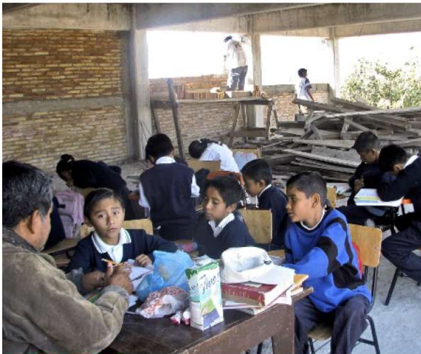
ENTRE RUIDO Y POLVO. Los alumnos de segundo grado de la primaria "Gregorio Torres Quintero" toman clases mientras les construyen las paredes de su salón.