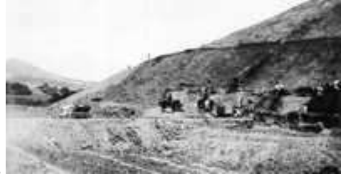
DOS ASPECTOS DE LA ZONA PREHISPÁNICA DE TEOTIHUACÁN, CAPTADOS EN 1905

Si no existe un plan de desarrollo, un guión, un proyecto de educación y cultura para organizar las visitas nocturnas de luz y sonido en Teotihuacán “se está creando un Disneylandia”, subrayó Olga Orive, integrante del Consejo Internacional de Monumentos y Sitios (Icomos-México), adscrito a la Organización de Naciones Unidas para la Educación, la Ciencia y la Cultura (UNESCO).