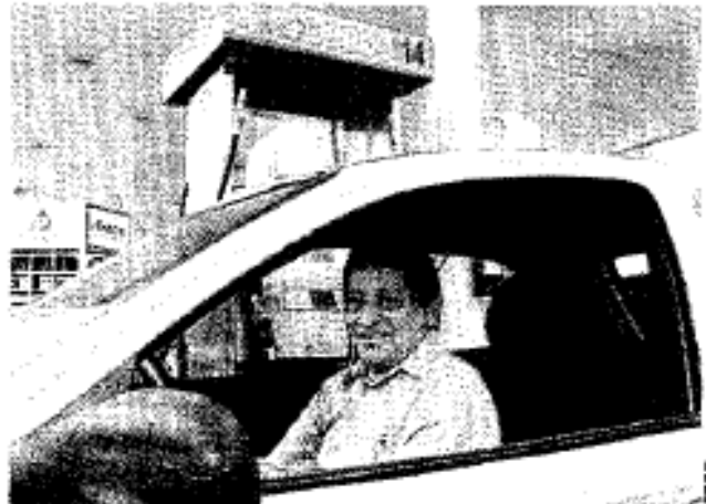
Ingenieros, arquitectos y médicos son choferas del servicio público

Explicó que una de las razones es el "excedente" de administradores, contadores y abogados que trabajan en medios diferentes a las especialidades en que se formaron en las universidades.