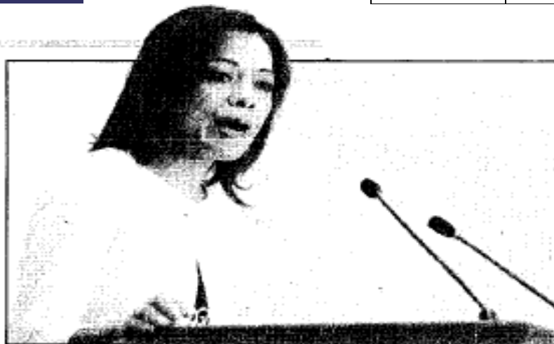
Vázquez Mota exhortó a los empresarios a quitar obstáculos.