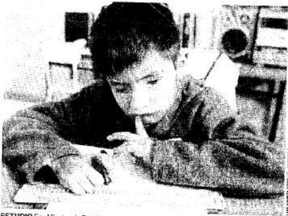
ESTUDIO En el Centro de Rehabilitación para Personas Ciegas y Débiles Visuales, los niños aprenden a moverse por si mismos, lo que facilita su entrada a escuelas regulares