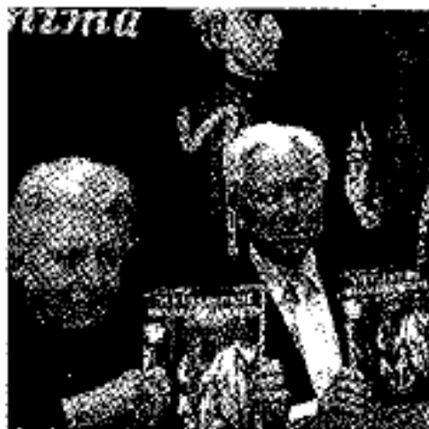
Estudiantes tendrán nuevo ejemplar