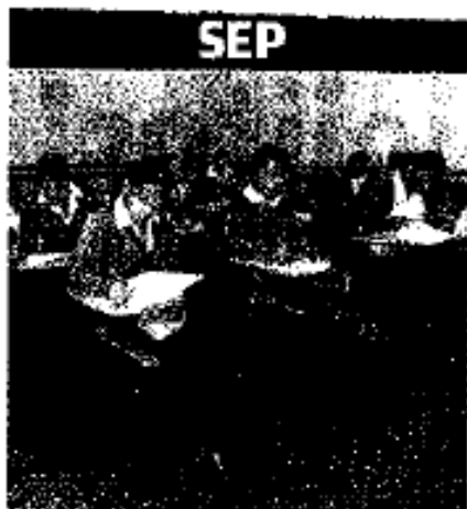
Les pintan panorama negro