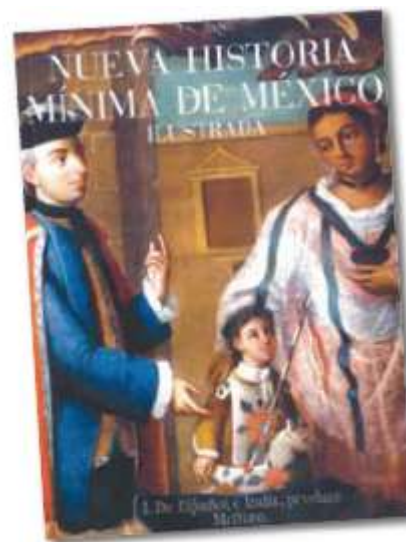
El volumen es una nueva versión del texto de El Colegio de México.