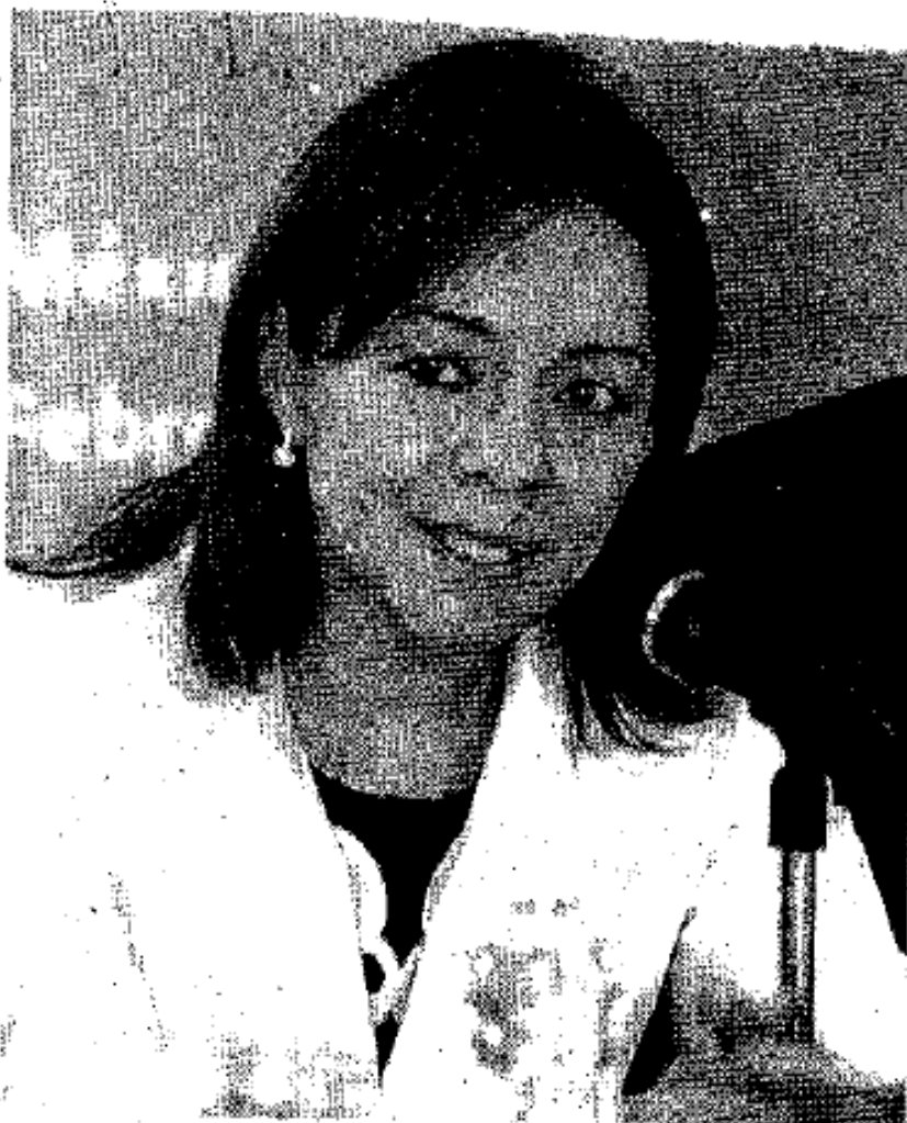
DEFENSA: Los empresarios deben considerarlos para ocupar un puesto.