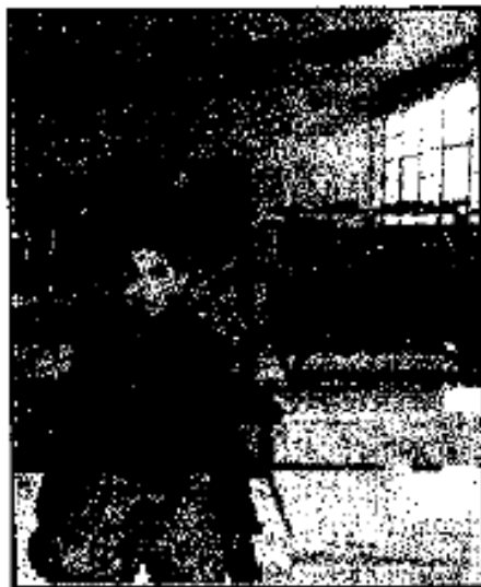
Les renovarán el mobiliario

En la entrega de los primeros 102 planteles de preescolar, primaria y secundaria remodelados me-