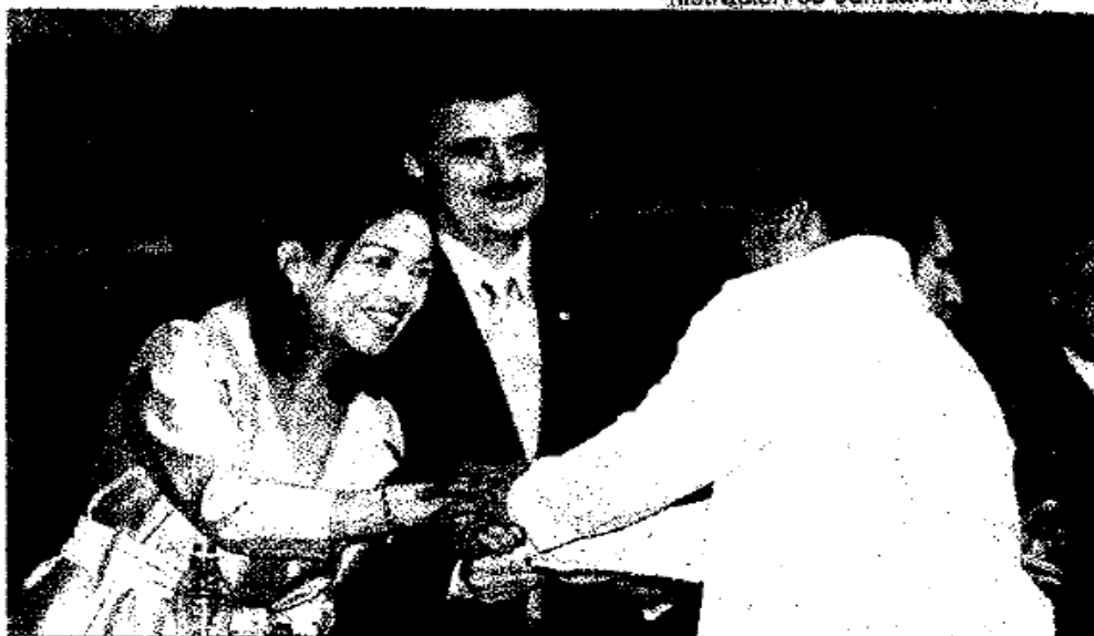
La titular de la Secretaría de Educación Pública, Josefina Vázquez Mota, entregó a alumnos destacados estímulos económicos frente a cientos de niños de escuelas secundarias presentes en el Auditorio Nacional.

La titular de la SEP anunció que se abrirán 10 nuevos tecnológicos de Educación Superior en la capital mexicana; ya hay tres, van a construir siete más, y a lo largo de esta administración se edificarán 16.