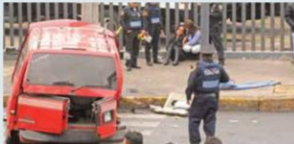
El 29 de junio en Eje 6 Sur chocaron dos camionetas en las que viajaban menores que iban camino a la escuela.

escuelas públicas de nivel básico hay, de acuerdo con el Inegi