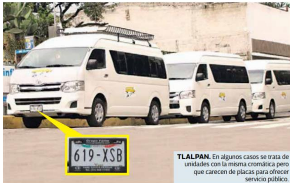
TLALPAN. En algunos casos se trata de unidades con la misma cromática pero que carecen de placas para ofrecer servicio público.