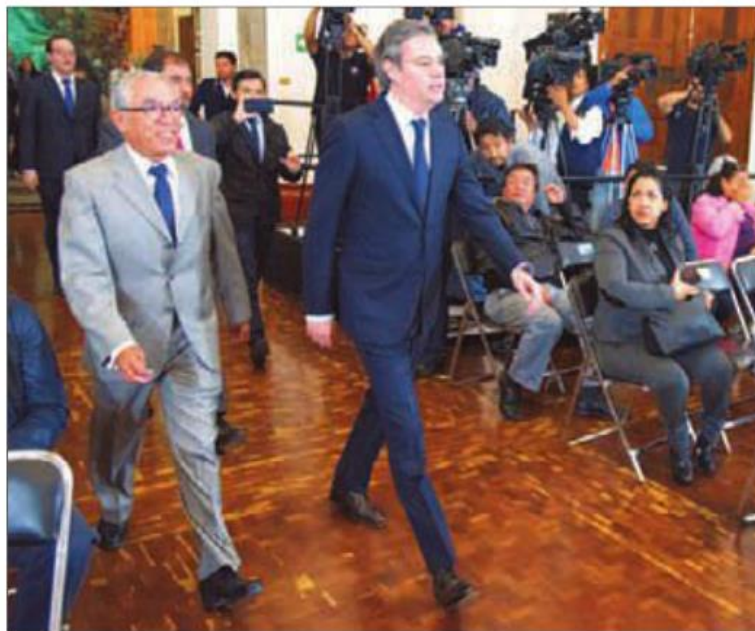
El titular de la SEP, Aurelio Nuño, arriba al salón Iberoamericano, donde se realizó la ceremonia de entrega.