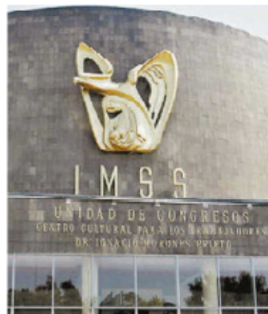
Centro Médico siglo XXI.

De acuerdo con las estadísticas, de los más de cuatro mil medios de impugnación resueltos en el semestre, al menos 70 corresponden a recursos de inconformidad interpuestos por ciudadanos contra las resoluciones emitidas por los institutos de transparencia de distintas entidades federativas. M