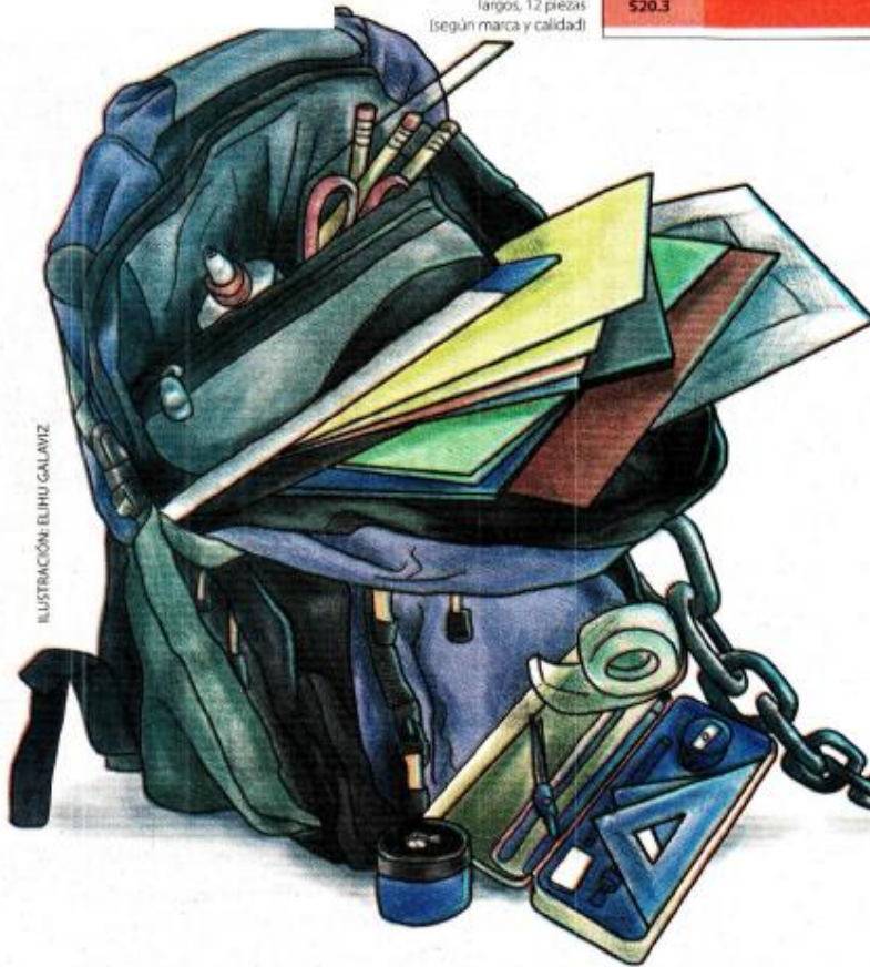
ILUSTRACIÓN: ELIHO GALAVIZ