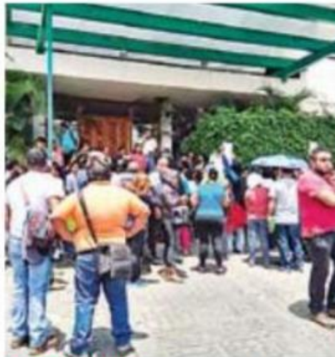
DESCONTENTO. La CNTE se movilizó en contra del nuevo sistema educativo.