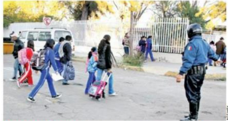
DE VUELTA A LOS LIBROS. Los alumnos de educación básica han concluido el período vacacional y regresarán a clases hoy.

El secretario informó también que alrededor de 659 mil maestros han presentado la evaluación de ingreso al Servicio Profesional Docente y que cerca de 389 mil obtuvieron una plaza por concurso, recibiendo nombramientos de manera transparente. También informó que unos 180 mil docentes han presentado la