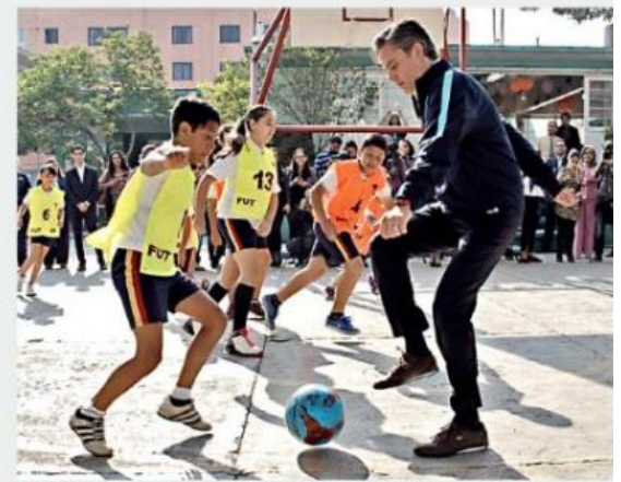
El 3 de mayo, el titular de la SEP jugó fútbol con alumnos de la primaria "Chipre" de la Ciudad de México.

Al igual que Miguel Ángel Osorio Chong y que el Presidente Enrique Peña Nieto, suele utilizar el recurso de un templete al centro rodeado de gradas saturadas de invitados con transmisiones en vivo, las cuales se extienden hasta el momento de las selfies y los saludos de mano.