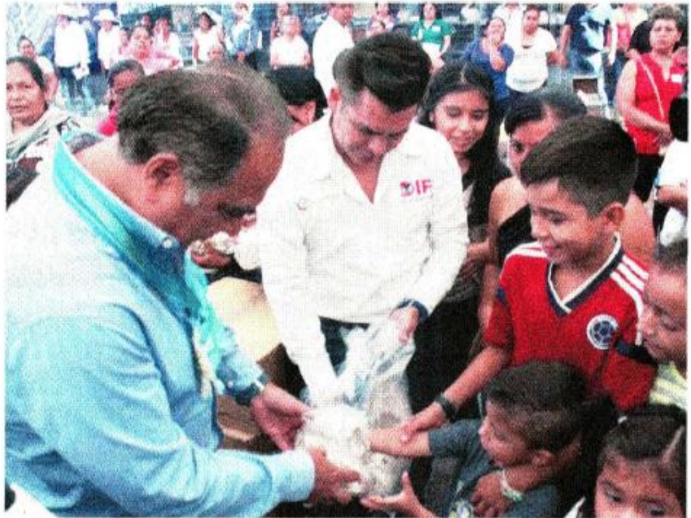
El gobernador Héctor Astudillo dijo que, por segundo año consecutivo, se logró la entrega de fertilizantes de forma gratuita, en la zona de La Montaña.

Astudillo dijo que su deseo, a unas horas de que inicie formalmente el ciclo escolar 2017-2018, “es que sea un buen año escolarmente hablando, que a los maestros les vaya bien, porque Guerrero los necesita”.