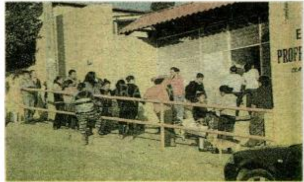
La CNTE amenaza con más movilizaciones.

Durante el periodo vacacional, estos grupos y los normalistas realizaron movilizaciones para presionar a las autoridades y les otorguen entre otras cosas, plazas automáticas a los egresados de las normales y la regularización de docentes que no se presentaron a la evaluación.