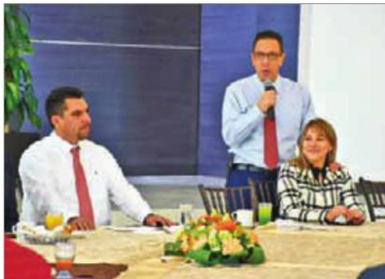
El gobernador Omar Fayad destacó el diálogo abierto con autoridades de la UAEH.

Al gobierno del estado lo involucran en contrapartes y paripastos que no fueron pactados con la actual administración, ya que la Federación les ofrece 20 millones y al estado le correspon-