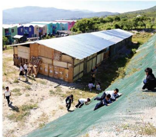
La escuela no cuenta con servicios ni con matrícula oficial.

En el ciclo escolar pasado se inscribieron 70 niños, y en el que empezó este lunes se apuntaron 110, además de que una casa del fraccionamiento se habilitó para atender a un grupo de educación preescolar, y los colonos se organizaron para construir otra galera para un grupo de educación secundaria.