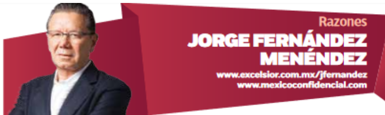
Razones JORGE FERNÁNDEZ MENÉNDEZ www.excelsior.com.mx/jfernandez www.mexicoconfidencial.com