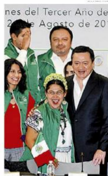
El secretario de Gobernación.

de año provocados por el alza de los precios de los combustibles y por las protestas de la CNTE. M