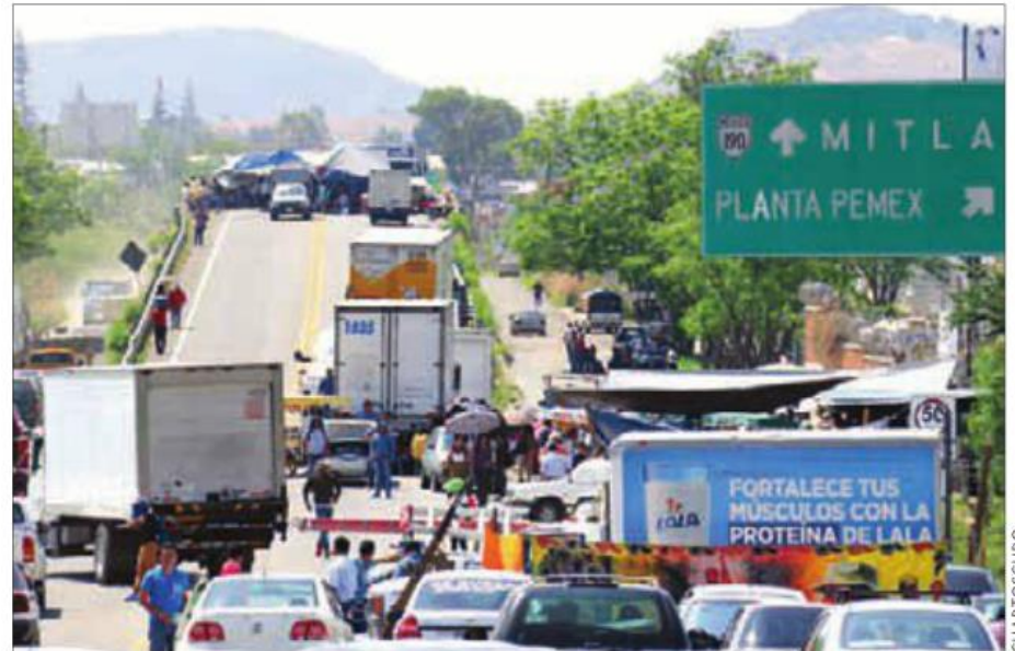
La Sección 22 informó que bloqueará al menos 14 puntos carreteros y dejará sin clases a un millón de alumnos.

“No habrá actividades, se suspende, se hace un llamado de manera masiva a todo el magisterio oaxaqueño porque salgamos en protesta y también posicionándonos y diciéndole al go-