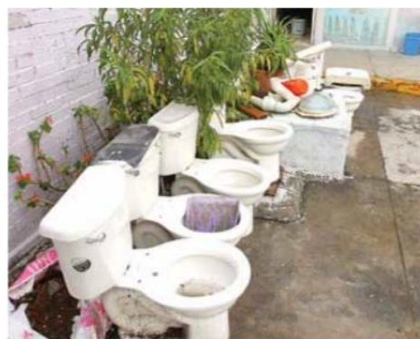
Los baños que se sustituirían se encuentran en el patio del plantel.

PROTESTA. Los padres de familia del kínder María Pérez Valiente, se manifestaron por segunda ocasión para pedir que se retomen las obras en el plantel, ya que llevan tres semanas de clases perdidas.