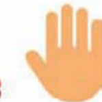
Falta de apetito

recuerdan el temor, las situaciones que han vivido y comienzan a externar su inconformidad de regresar a clases.