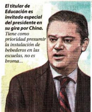
Agua que no has de beber