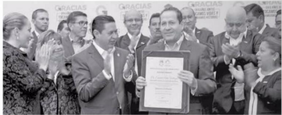
TOLUCA.- El gobernador Eruviel Ávila Villegas muestra el agradecimiento del que fue objeto por parte del Sindicato de Maestros al Servicio del Estado de México

Elo, en el marco de un encuentro con servidores públicos de la Secretaría de Educación, en el que resaltó que miles de niños y jóvenes cumplieron sus sueños y salieron adelante gracias a las becas y apoyos que les fueron otorgados, logrando así tocar vidas y cambiar cientos de historias.