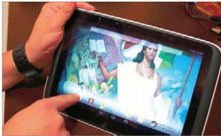
“Las conexiones de red necesarias para que los alumnos trabajaran con las tablets en las escuelas no funcionaron”.

En el proceso autogestivo que impulsa la Secretaría de Educación Pública, hoy por hoy, las escuelas más organizadas, con padres de familia más participativos, que, o bien