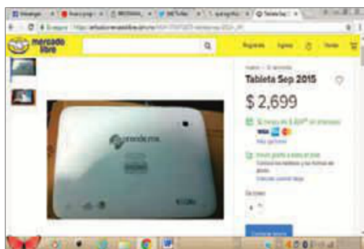
Las tablets que se otorgaron entre 2014 y 2015, hoy se ofrecen en línea por 2 mil 699 pesos.

La posición actual de la autoridad educativa es que de experiencias como los programas de laptops y tablets, aun con las limitaciones que experimentaron, los alumnos sí adquirieron habilidades digitales y se ha obtenido información que permite replantear la estrategia: se regresará al modelo de aulas digitales. El problema consiste en que para que eso ocurra, y en forma de programa piloto, aún falta un año; precisamente, el último de esta administración.