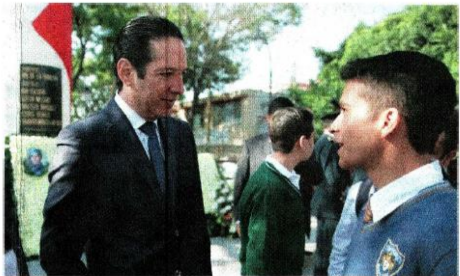
El gobernador Francisco Domínguez Servién visitó escuelas de Arroyo Seco, donde entregó obras de infraestructura.

En la cabecera municipal de Arroyo Seco, el mandatario estatal visitó la