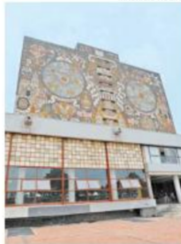
LA BIBLIOTECA de la UNAM

Aunque el regreso está pactado para hoy lunes, los alumnos inconformes realizarán una asamblea por la mañana pa-