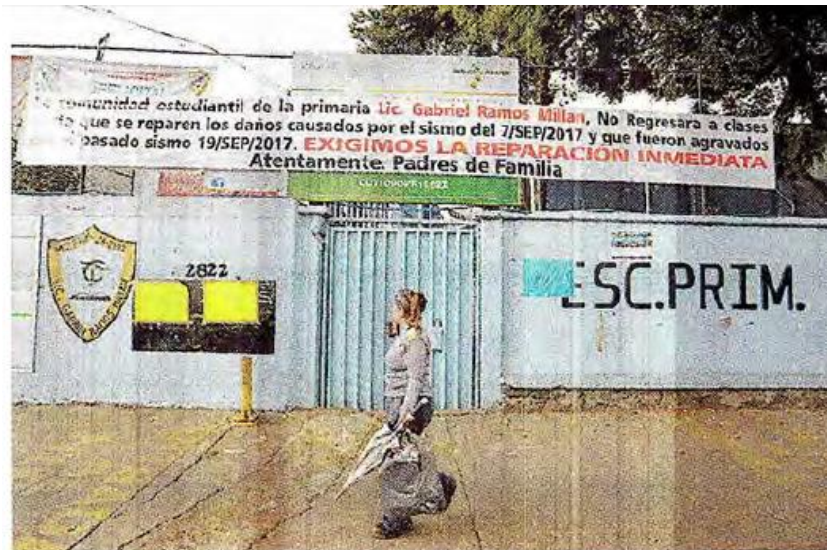
Con mantas, exigen la reparación inmediata de los planteles.

comunidad estudiantil de la primaria Gabriel Ramos Millán no regresará a clases hasta que se reparen los daños causados por el sismo del 7 de septiembre de 2017 y que fueron agravados por el pasado sismo del 19 de septiembre de 2017. Exigimos la reparación inmediata. Atentamente: padres de familia”.