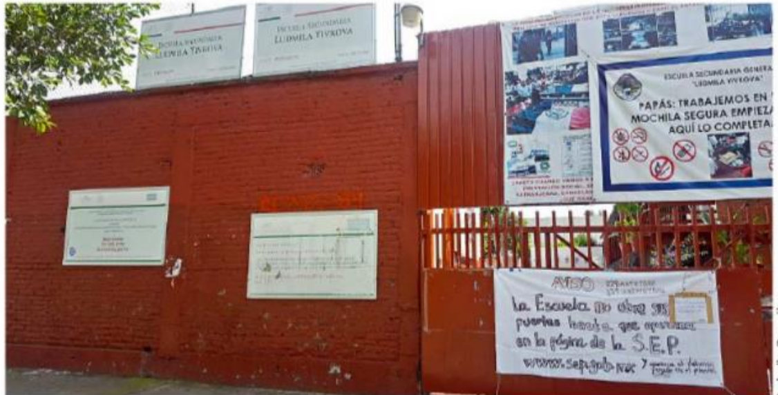
■ La secundaria 229 'Ludmila Yivkova' espera contar con el dictamen de seguridad estructural.

Dalila Juárez, madre de familia de una estudiante en dicho plantel, expresó preocupación por el retraso que puede ocasionar en los