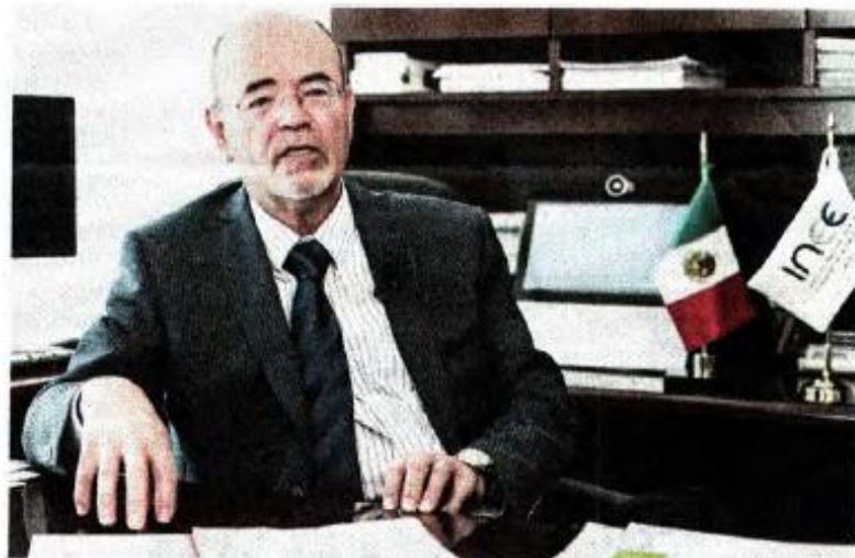
GERMAN ESPINOSA, EL UNIVERSAL

Hay cambios positivos en general, pero son cambios inerciales. La mayor deuda que tiene el país con sus estudiantes son los aprendizajes.