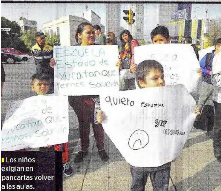
Los niños exigían en pancartas volver a las aulas.