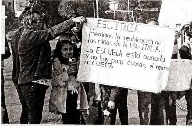
EN LA colonia Guerrero, padres y niños bloquearon Reforma

El plantel se vio dañado no por el sismo en sí, sino debido a que el 24 de septiembre la cúpula de la iglesia de Nuestra Señora de los Angeles, que se encuentra en el costado izquierdo, se derrumbó y cayó sobre tres salones de