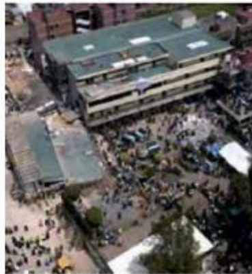
EN EL COLEGIO de la delegación Tlalpan murieron 26 personas.

De acuerdo con autoridades de la Procuraduría General de Justicia de la CDMX (PGJCDMX) el Ministerio Público que indaga el caso recibió ya dichos dictámenes y los tres expedientes que le