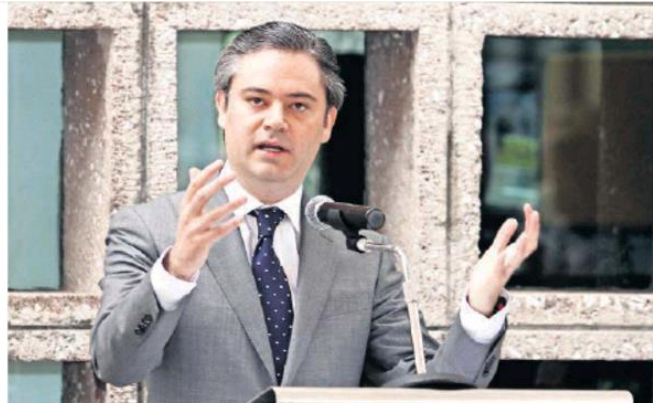
Tras lo ocurrido en Monterrey, el titular de la SEP, Aurelio Nuño, recalcó la inclusión de habilidades socioemocionales en el nuevo modelo educativo.

blema es llevar el respeto como contenido. No sólo es aprender a recitar qué quiere decir la palabra respeto", dijo.