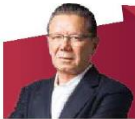
Razones JORGE FERNÁNDEZ MENÉNDEZ www.excelsior.com.mx/jfernandez www.mexicoconfidencial.com