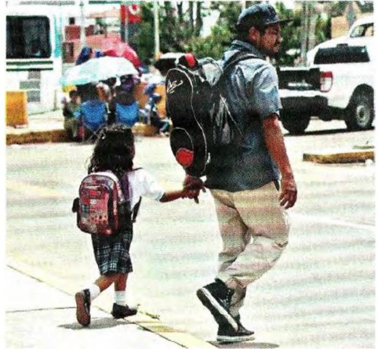
■ Hoy reanudan clases alumnos de 10 entidades del País.

Para reconstruir totalmente las escuelas, la SEP deberá tener el proyecto ejecutivo, y el 6 de diciembre, con fondos de los seguros de los planteles y del Fonden, comenzarán las obras que