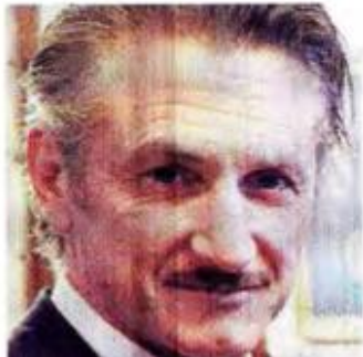
Sean Penn Productor y director de cine

Un juez federal dejó sin efecto el auto de formal prisión contra la exlíder del SNTE, Elba Esther Gordillo, acusada por la PGR de los delitos de operaciones con recursos de procedencia ilícita y delincuencia organizada. El fallo es el segundo de los tres juicios que ha perdido la PGR en contra de Gordillo, quien continuará en prisión.