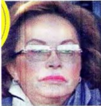
Elba Esther Gordillo Exdirigente del SNTE

Un juez federal dejó sin efecto el auto de formal prisión contra la exlíder del SNTE, Elba Esther Gordillo, acusada por la PGR de los delitos de operaciones con recursos de procedencia ilícita y delincuencia organizada. El fallo es el segundo de los tres juicios que ha perdido la PGR en contra de Gordillo, quien continuará en prisión.