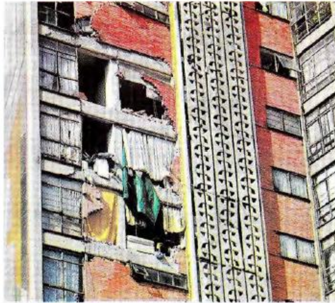
Daños en un inmueble de la colonia Doctores.

Entre las principales violaciones al reglamento señaló la separación entre edificios, que, según el artículo 211, no debe ser menor a cinco centímetros y debe ir aumentando conforme la elevación de sus niveles, es decir, en edificios de tres a nueve pisos debe ser de entre 10 y 12 centímetros. M