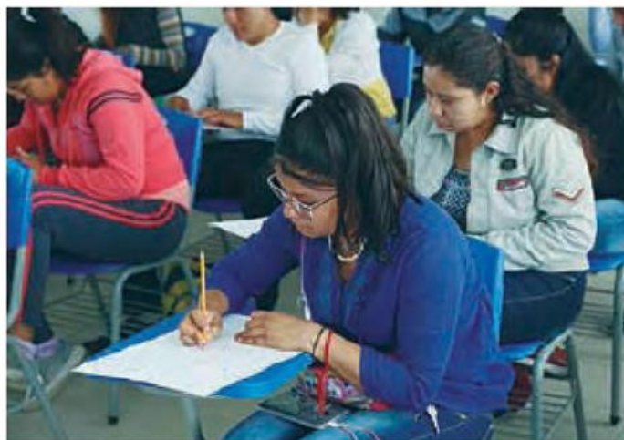
Reubican a estudiantes en varias zonas de Puebla.

En entrevista, dijo que cinco mil 318 escuelas públicas y dos mil 413 privadas ya regresaron a clases, es decir, un total de siete mil 731 instituciones educativas, lo que representa un 80 por ciento de la matrícula de los 112 municipios con declaratoria de emergencia.