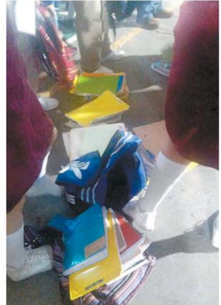
En la secundaria 2 usan el modelo.

La operatividad del sistema tiene un costo anual de 3 millones de pesos, de los cuales 500 mil son para personal de