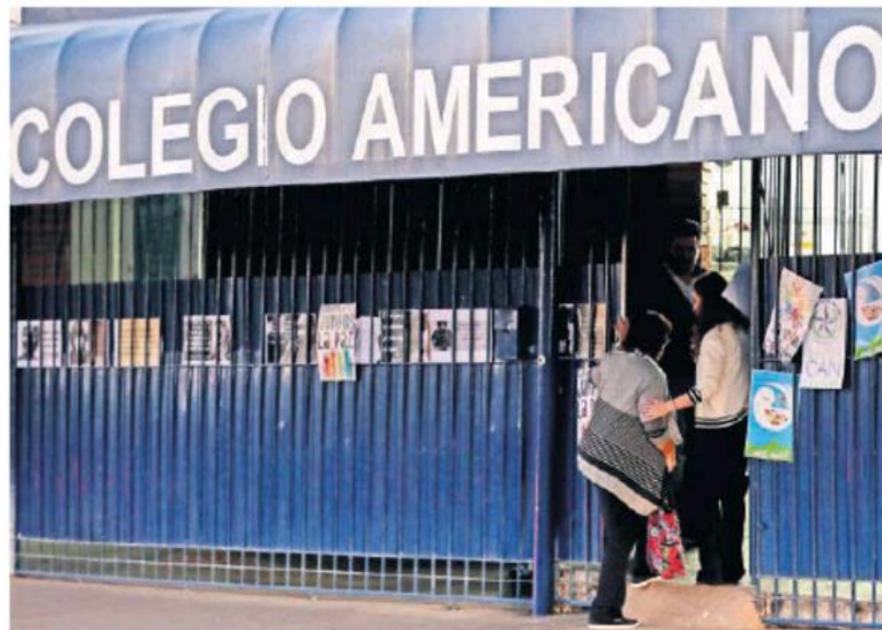
Expertos opinaron que incidentes como el de Monterrey se pueden prevenir si el gobierno aplica la ley para prevenir y atender la violencia escolar.