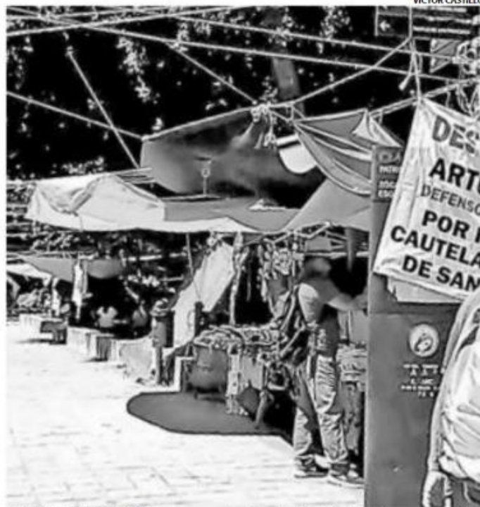
LOS MANIFESTANTES acapararon la plancha del zócalo, así como las calles de Guerrero y Armenta y López

■ Sin resultados, las mesas de diálogo entre gobierno y la sección 22