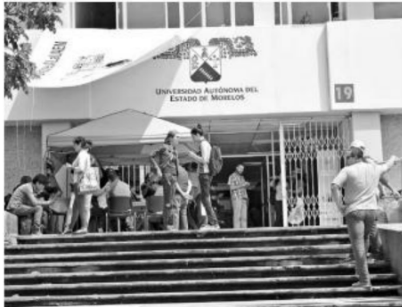
ENOJA A los trabajadores ir a fin de semana largo sin salario

La justificación por parte de la administración central fue en cuanto a que el 30 de octubre, en las oficinas de la Subsecretaría de Educación Superior (SES), los rectores de las universidades Michoacana de San Nicolás de Hidalgo (UMSNH), Autónoma del Estado de Morelos (UAEM), Autónoma de Nayarit (UAN), Autónoma Benito Juárez de Oaxaca (UABJO), Juárez Autónoma de Tabasco (UJAT) y Autónoma de Zacatecas (UAZ), se