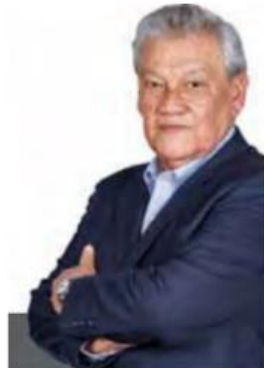
Por Francisco Cárdenas Cruz

Como parece ser que la efervescencia política, no solamente fuera, sino también dentro del PRI empieza a salirse de control, por más que su dirigencia lo niegue, los próximos días y semanas se espera que en ese partido, quizá antes de la fecha fijada para diciembre, haya luz verde para dar a conocer quién, de los cuatro miembros del gabinete mencionados como prospectos, será finalmente su candidato a la Presidencia de la República.