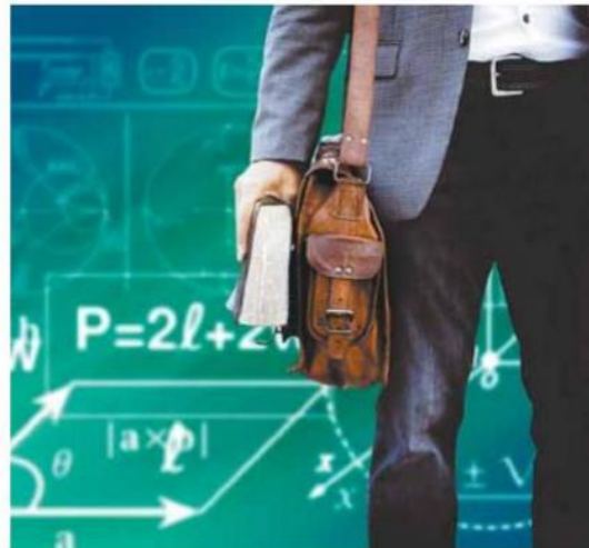
Las nuevas normas buscan que las universidades particulares ejecuten programas de mejora permanente.

Un estudio publicado este año por el Banco Mundial da cuenta de cómo la educación superior está disponible hoy para más jóvenes en América Latina y el Caribe que en cualquier otro momento en la historia de la región: en la última década se duplicó el número de estudiantes, entre los 18 y 24 años de edad, matriculados en ese tipo educativo, al pasar del 21 por ciento en 2000 al 40 por ciento en 2010. Al mismo tiempo, alrededor de un cuarto de las instituciones de educación superior (IES) que existen actualmente abrieron sus puertas en ese mismo período —muchas del sector privado— elevando la cuota de mercado de las instituciones particulares (en adelante IPES) de 43 a 50 por ciento entre comienzos de la década de 2000 y 2013.