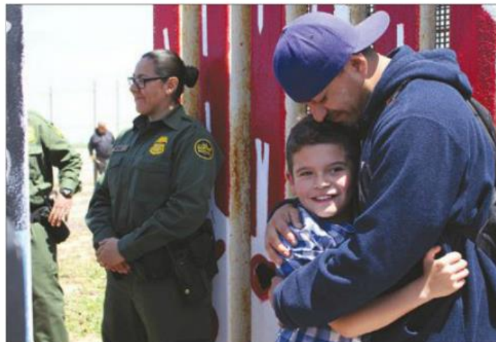
Miles de niños mexicanos son repatriados de EU cada año.