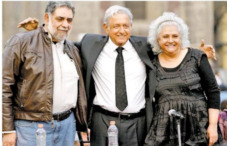
Al centro, Andrés Manuel López Obrador, presidente nacional de Morena.

¿Quién puede creer "la mamucada" de que Trump es un peligro para México, cuando en México existen clones como AMLO y El Bronco —entre muchos otros—, que han probado que son un peligro para México y han hecho crecer sus ambiciones