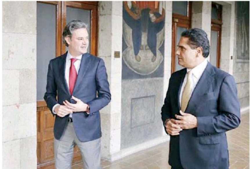
Durante la reunión con el titular de la SEP, Aureoles destacó la regularización de las plazas docentes, al igual que los pagos pendientes a los profesores.

La jóvenes procedentes de Cherán, Ichán, Comachuén, Tarecuato, Nahuatzen, Chilchota y Quiroga recibirán un curso de actualización durante tres meses para poder postular a maestrías de calidad, con becas de 90 mil pesos