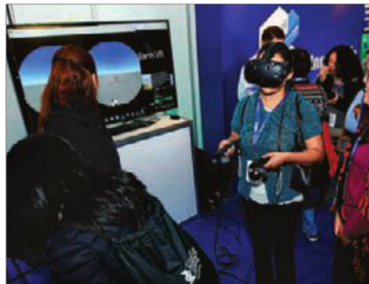
Para su cuarta edición el CIE espera la asistencia de alrededor de tres mil 500 personas.

Un nuevo esquema innovador en la educación, ejemplifica, se centraría en avanzar con el alumno hasta que haya aprendido, en vez de etiquetarlo en un grado y después evaluarlo con un examen al final del curso. Otro recurso, agrega el académico del Tec, es el desarrollo de competencias en los alumnos, lo cual aunque se ha malinterpretado dentro de su ejercicio en la educación en el