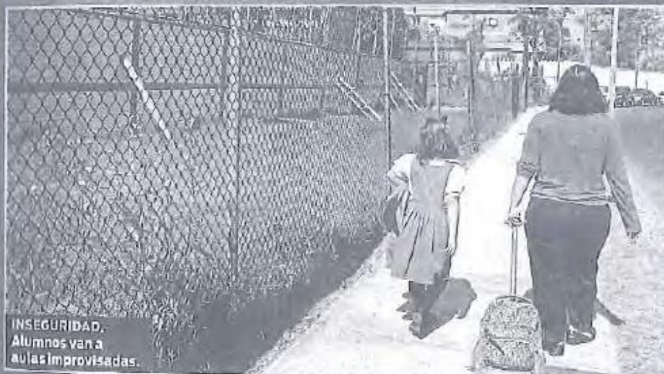
INSEGURIDAD. Alumnos van a aulas improvisadas.

Barda perimetral del Jardín de Niños 'Centenario', en Tlalpan, quedó dañada por el 19-S; la escuela carece también de dictamen de daños