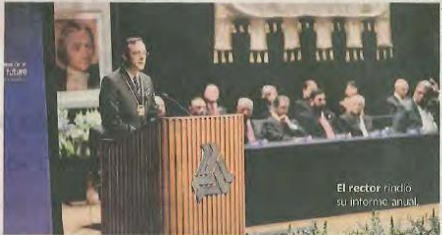
El rector rindió su informe anual.

Resaltó además el enfoque humanista que se centra en el crecimiento de las personas, así como en trabajar para que la educación no se limite al ámbito de la academia, sino a las relaciones espirituales, deportivas, artísticas y sociales.