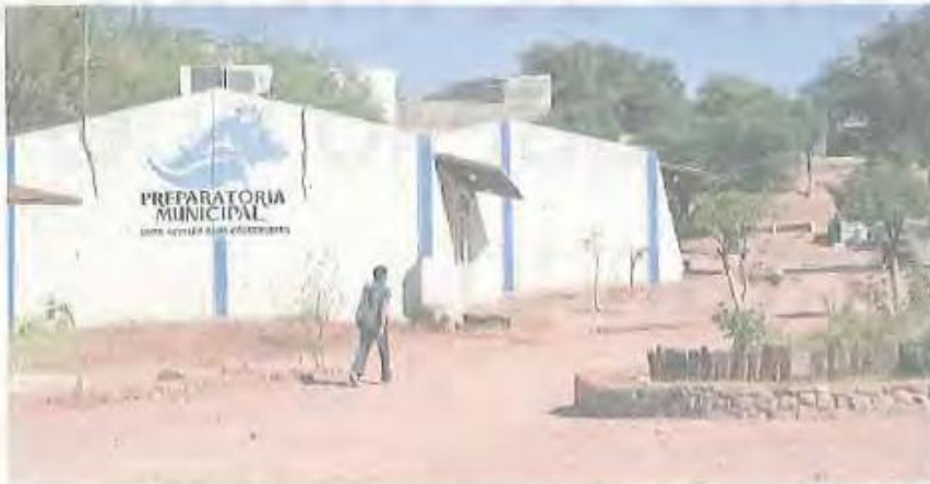
La Preparatoria Municipal de Nogales Omar Osvaldo Romo Covarrubias, Campus Colosio, se encuentra incorporada a la Universidad de Sonora.

crear programas informáticos para empresas. Al público en general, la preparatoria ofrece formación y capacitación para las personas que desean obtener conocimientos o habilidades para su desarrollo personal o profesional, como centro de capacitación autorizado por la Secretaría del Trabajo.