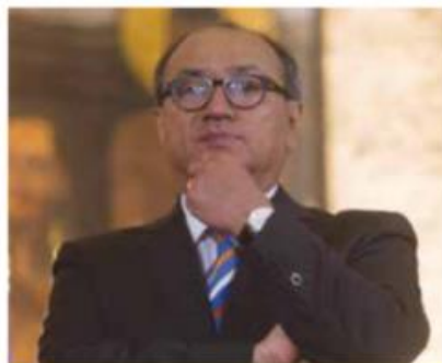
OTTO GRANADOS ROLDÁN, SECRETARIO DE EDUCACIÓN PÚBLICA, TIENE EL TIEMPO ENCIMA, PERO LE SOBTRAN TALENTO Y DESTREZA POLÍTICA

El complemento indispensable de una estrategia de alto crecimiento sustentada en la inversión extranjera innovadora es la educación pública de calidad.