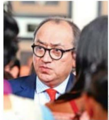
REUNIÓN. Otto Granados, titular de la SEP, dijo que México avanza con la reforma educativa.

Más tarde, se reunió con el actual secretario general del Sindicato Nacional de los Trabajadores de la Educación (SNTE), Juan Díaz de la Torre, y con integrantes de órganos nacionales de gobierno sindical y secretarios generales seccionales, en el salón Iberoamericano de la institución, donde Granados Roldán anunció la realización del Séptimo Congreso Nacional Extraordinario de la organización gremial, del 12 al 14 de febrero de 2018.