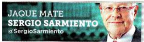
JAQUE MATE SERGIO SARMIENTO @SergioSarmiento

Se celebra el sol invicto en Navidad, el milagro de que el sol se niegue a rendirse.