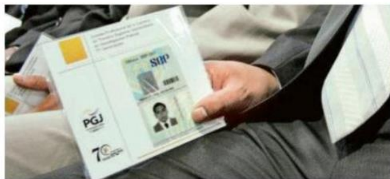
La oficina de expedición de cédulas profesionales volvió a dar servicio

4 MESES PERMANECIÓ cerrada la oficina y detenidos los trámites de cédulas profesionales