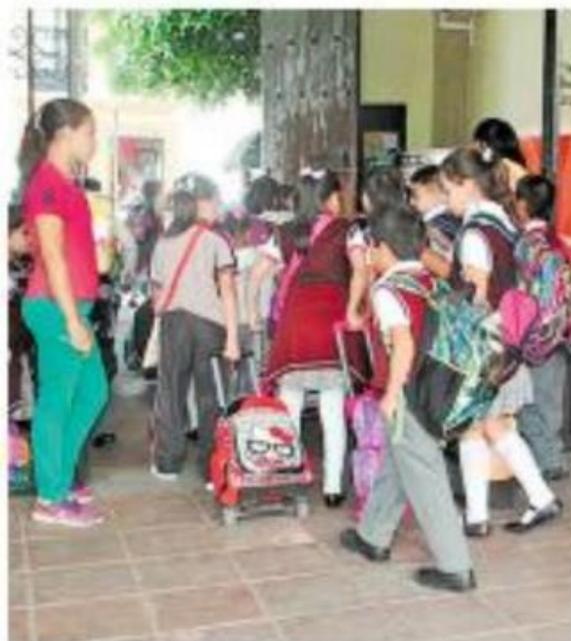
En educación básica regresaron alrededor de 965 mil estudiantes. Cortesía

Se habilitaron espacios provisionales en tanto la reconstrucción de escuelas queda lista, en marzo, de acuerdo con lo que plantearon las autoridades a cargo del proceso. Víctor Castillo/Corresponsal