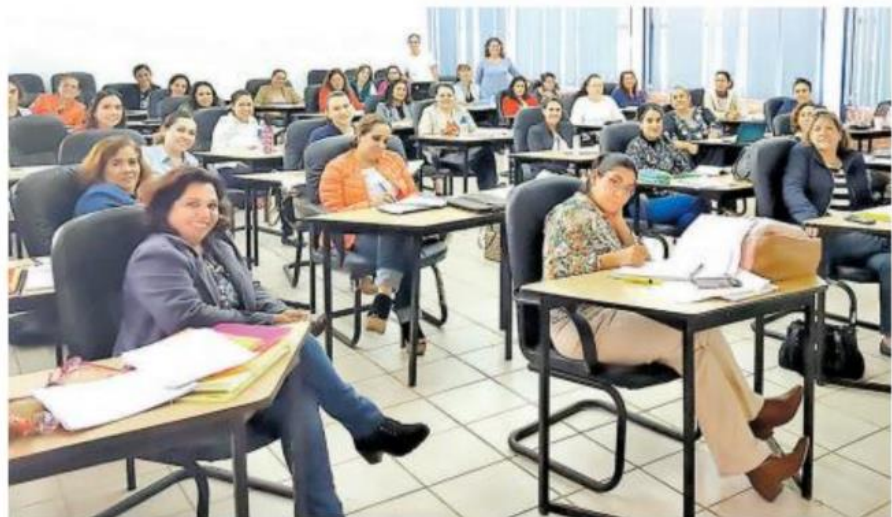
La evaluación y capacitación es parte medular de la reforma

De acuerdo con el documento La Reforma Educativa mexicana: Balance, Perspectivas y Retos , que el secretario de Educación Pública, Otto Granados Roldán, presentó a los embajadores de México en el extranjero durante una reunión privada, la instrumentación de la reforma en