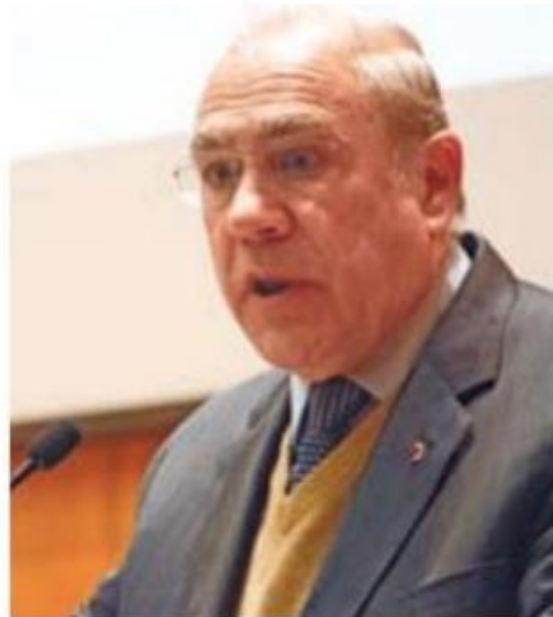
ENCUENTRO. José Ángel Gurría, secretario general de la OCDE, ayer en el ITAM de la CDMX.

Granados Roldán y Gurría Treviño hablaron sobre la recomendación cuatro de la OCDE, relacionada con la identificación de las habilidades necesarias para ingresar y completar con éxito niveles superiores de educación, con el fortalecimiento de los están-