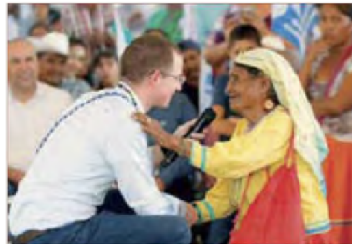
RICARDO Anaya en un encuentro con simpatizantes de Nayarit, ayer.

“Vine para platicar y a escuchar, para hacer propuestas concretas para mejorar las condiciones de vida de la gente” expresó tras llamar a los jóvenes a estudiar y así ayudar a sacar adelante a su gente.