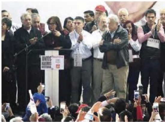
ANDRÉS MANUEL López Obrador, ayer, en Nuevo León.

El morenista encabeza mitin en Monterrey; pide a sus militantes y a los de PES y PT evitar confrontaciones