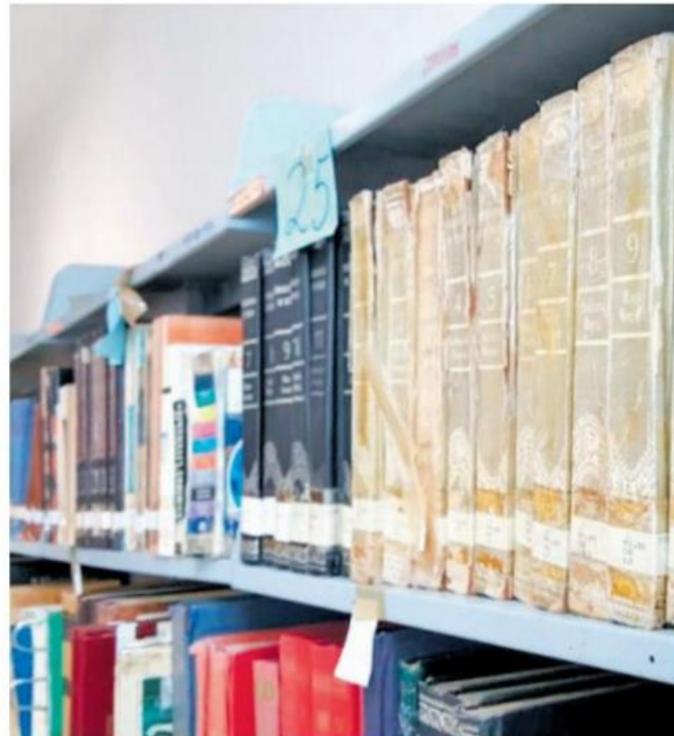
Muchos ejemplares son antiguos y no sirven para consulta

La tecnología con la compra de libros virtuales también ha pegado a este esquema de consulta tradicional, pero tampoco la Red Nacional de Bibliotecas Públicas ha dotado de la tecnología para ofrecer este servicio de consulta virtual.